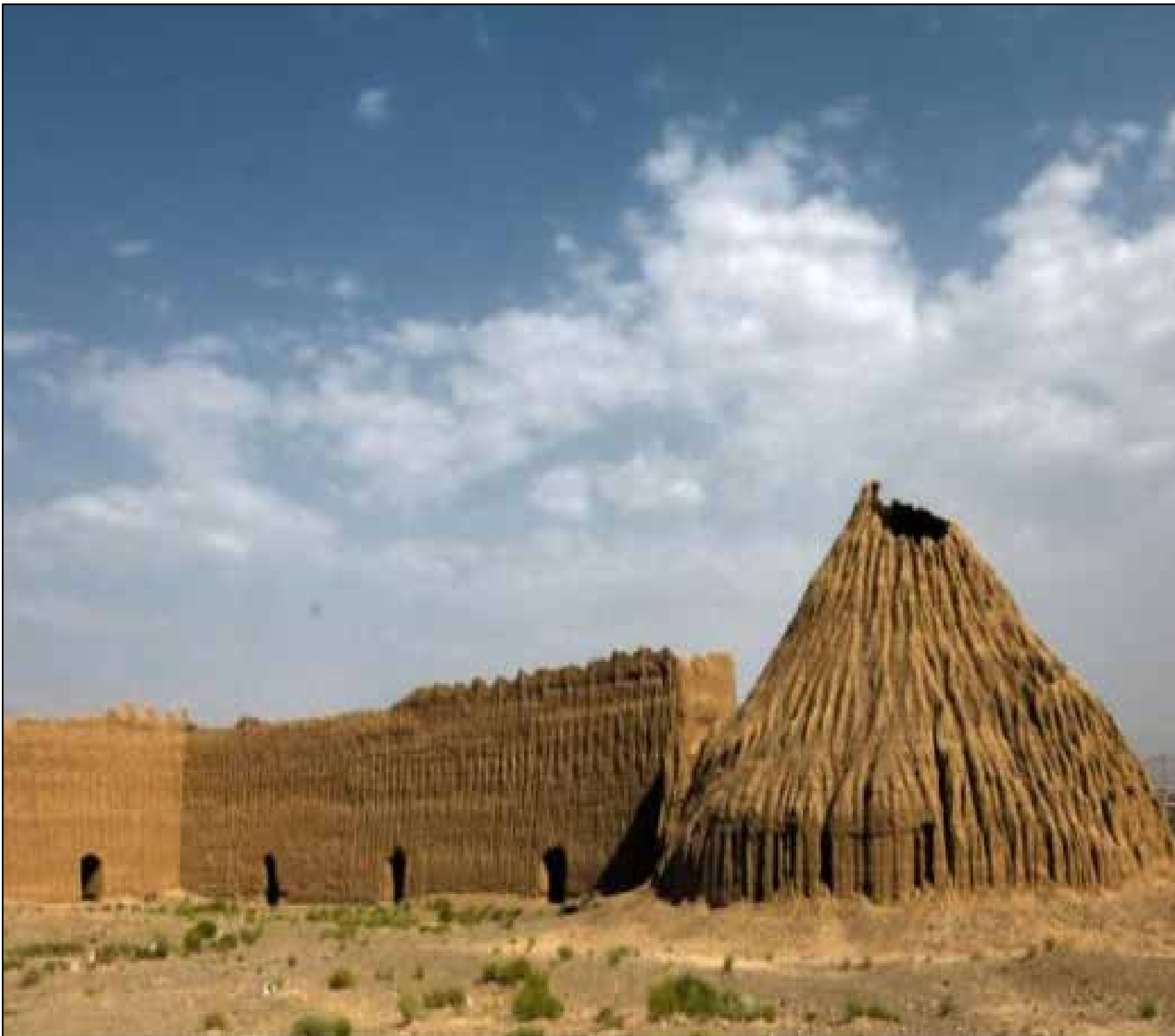
یخدان تاریخی لنگر

در زمانی که هنوز تکنولوژی‌های بشری وسایلی مانند یخچال را نساخته بود، مردم مناطق گرمسیر ایران با استفاده از هوش خود و به‌کارگیری طبیعت برای روزهای گرم سال یخ ذخیره می‌کردند. روش کار بیشتر یخچال‌ها به این صورت بود که پس از ساختن آن با دیوارهای قطور که اجازه کمترین انتقال انرژی را می‌داد، در شب‌های سرد زمستان مقداری آب تمیز به آن هدایت می‌کردند تا یخ بزند و شب بعد روی این لایه یخ‌زده یک لایه دیگر اضافه می‌شد و سرانجام در پایان زمستان حجم بزرگی از یخ در یخچال آماده استفاده بود.