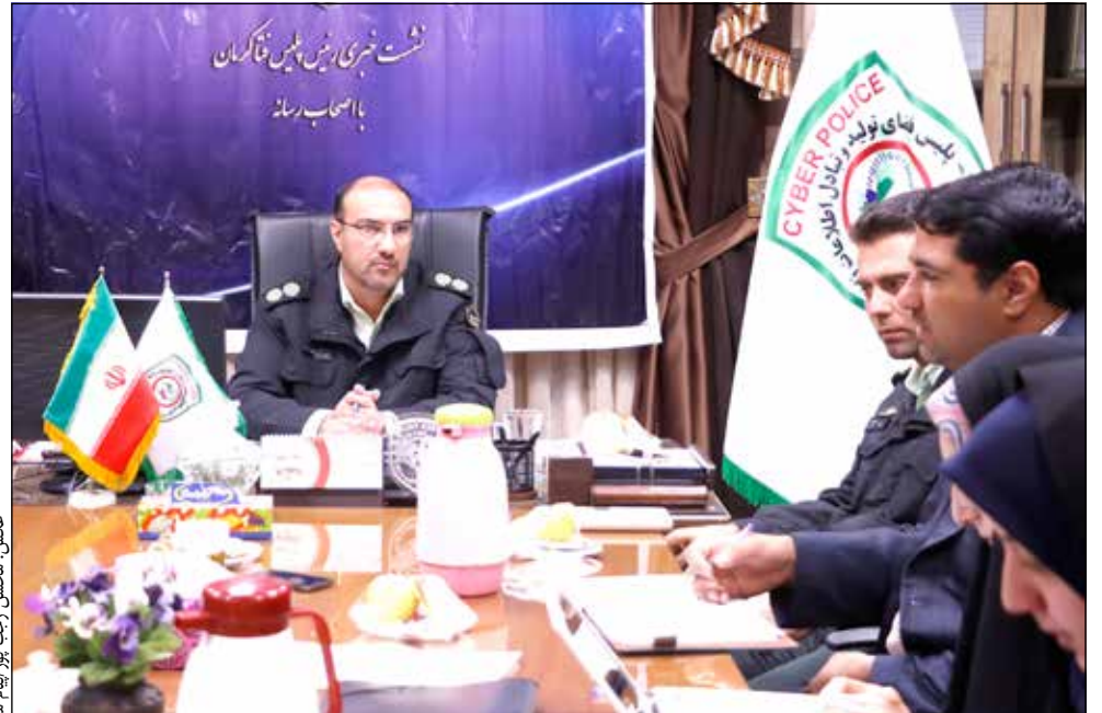
عملکرد ۱۰ ماهه پلیس در حوزه فضای مجازی صبح دیروز در نشست خبری سرهنگ امین یادگارنژاد، رئیس پلیس فتای کرمان با اصحاب رسانه بررسی شد.

وی در پایان توصیه کرد، خانواده‌ها به همراه فرزندان خود باشند و آنها را در شبکه‌ها فضای مجازی همراهی نمایند و اینکه شهروندان جهت فراگیری آموزش‌های لازم و همچنین گزارش و شکایات به تنها سایت مجاز پلیس فتا به آدرس www.Cyberpolice.ir هیچ کانال تلگرامی و یا سایت مشابه دیگری ندارد، مراجعه نمایند.