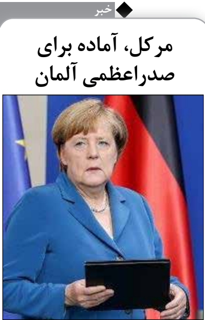
مرکل، آماده برای صدراعظمی آلمان

به نقل از نشریه بیلده، «هورست سیهوفر»، رهبر حزب اتحاد سوسیال مسیحی آلمان، اعلام کرد «آنگلا مرکل» تنها نامزد ائتلاف حاکم این کشور برای صدراعظمی در انتخابات پارلمانی سپتامبر خواهد بود.