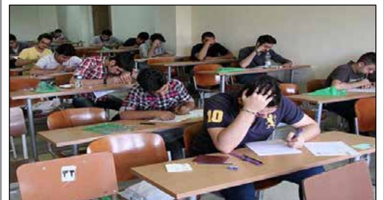
در حاشیه‌ی تجمع اعتراضی دانش آموزان دبیرستانی در اداره‌ی کل آموزش و پرورش استان کرمان