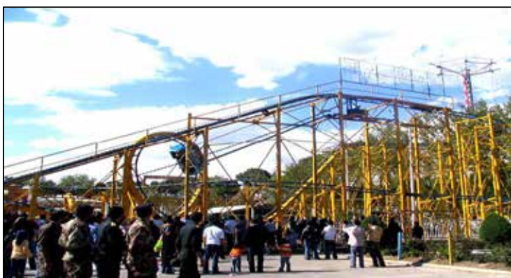
در آستانه تعطیلات تابستانی و شروع بکار مراکز بازی و تفریحی؛