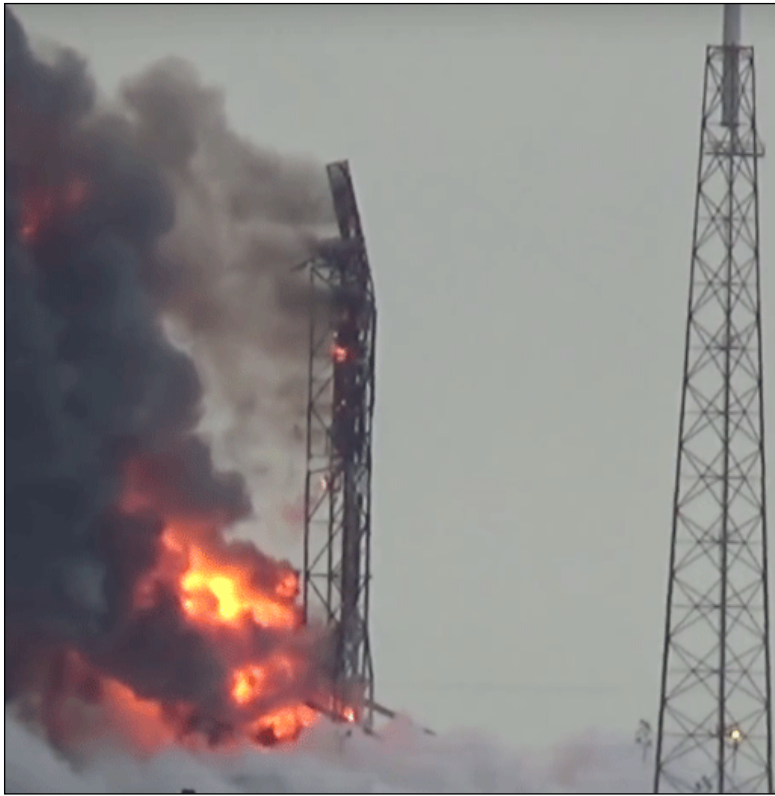
(کمپانی رقیب اسپیس ایکس) در ماه سپتامبر اعلام کرد: تاریخ نشان‌دهنده‌ی آن است که فرایند پرتاب راکت، به ۹ تا ۱۲ ماه زمان نیاز دارد

فدرال، ناسا و نیروی هوایی کماکان در حال بررسی حادثه‌ی ماه سپتامبر هستند و به احتمال زیاد، به‌زودی گزارش کاملی از نتایج بررسی‌های خود منتشر خواهند کرد. راکت فالکون ۹ تنها چند روز قبل از آنکه برای پرتاب ماهواره‌ی Amos ۶ به فضا به کار گرفته شود، روی سکوی پرتاب در کیپ کاناورال کالیفرنیا منجر شد. در این حادثه، ماهواره‌ی Amos ۶ از بین رفت؛ فیس‌بوک قصد داشت از این ماهواره در بخشی از پروژه‌ی Internet.org خود و برای فراهم کردن اتصال بی‌سیم در مناطق جنوبی صحرای آفریقا استفاده کند. ایلان ماسک، مدیرعامل اسپیس ایکس، اوایل ماه نوامبر اعلام کرد بررسی‌های این کمپانی نشانگر آن است که محفظه‌ی هلیوم فالکون ۹