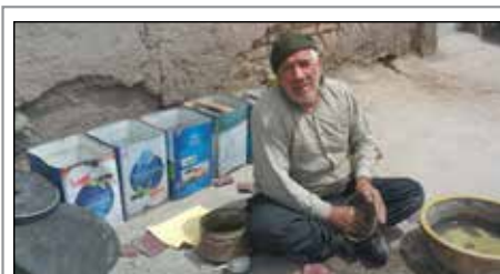
ساعتی با یک فلاگر کرمانی؛