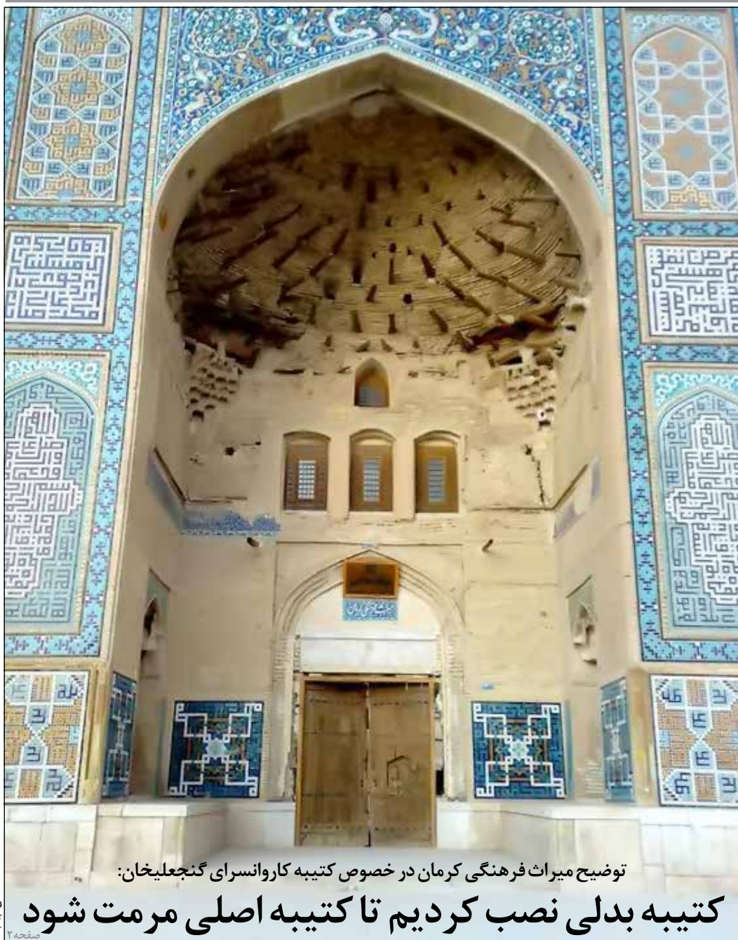
توضیح میراث فرهنگی کرمان در خصوص کتیبه کاروانسرای گنجعلیخان:

کتیبه بدلی نصب کردیم تا کتیبه اصلی مرمت شود