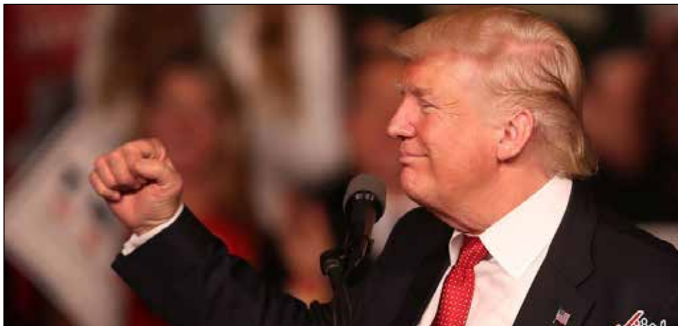
جعفر محمدی- عصر ایران چند هفته پیش هیلاری کلینتون در سالروز تولدش عکسی از خودش در توئیتر منتشر کرد و نوشت: تولد مبارک رئیس‌جمهور آینده آمریکا! هم او ، هم هوادارانش و هم قریب به اتفاق تحلیلگران سیاسی در آمریکا و سایر نقاط جهان،

تقریباً مطمئن بودند که چهل و پنجمین رئیس‌جمهور آمریکا، یک زن خواهد بود؛ نظرسنجی‌ها هم این را نشان می‌دادند. با این حال، از اولین ساعات اعلام نتایج، مشخص شد که دونالد ترامپ پیش افتاده است. در ابتدا گمان غالب بر این بود که با شمارش آرای ایالت‌های کلیدی، کلینتون برنده خواهد شد اما چنین نشد و هرچند در مقطعی کلینتون به ترامپ نزدیک شد اما هیچ‌گاه به او نرسید و به کاخ سفید هم، این نتیجه جهان را در شگفتی فروبرد. قیمت طلا بالا رفت، نفت و دلار افت کردند و شاخص بسیاری از بورس‌ها شکست. تا پیش از این، در همه انتخابات معاصر آمریکا، نظرسنجی‌ها دقیق بودند و از روی