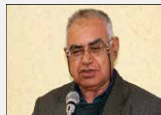
پروفسور مهدی رجبعلی پور نابغه ریاضی جهان