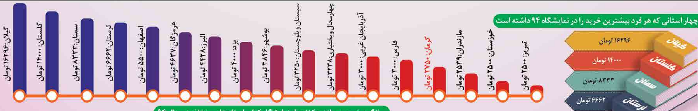
میانگین خرید هر بازدیدکننده از نمایشگاه کتاب استان های مختلف در سال ۹۴