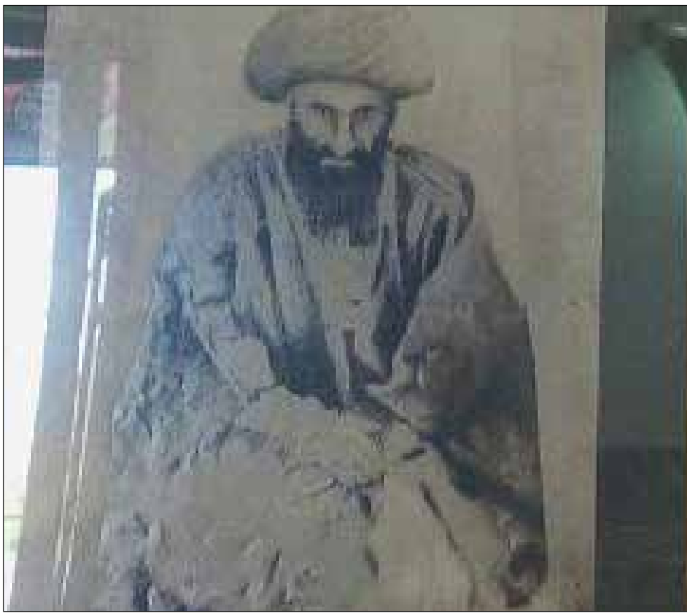
آیت الله سید جواد شیرازی امام جمعه کرمان

پس از وقوع حوادثی که منجر به عزل هلاکو میرزا شد، آیت الله شیرازی نیز به وطن خویش مراجعت نمود و در سفر دوم و بنابر خواهش حاکم جدید کرمان ابراهیم خان ظهیر الدوله، در کرمان رحل اقامت افکند. ناظم الاسلام، انتصاب وی به امامت مسجد جامع را در سال ۱۲۵۳ هق بیان کرده،