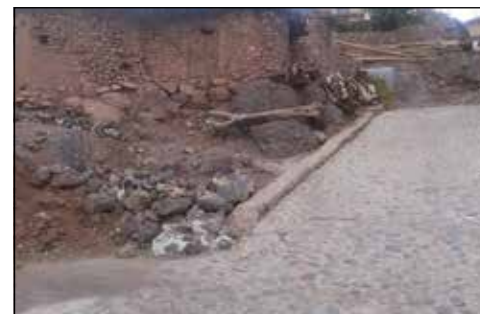
عکس شماره ۳

همسر می گوید: «احساس می کنم به چند قرن قبل برگشته ام. به شهری زیبا که در فیلم های سینمایی دیده ام. این جا به شهرک سینمایی می ماند!» و همین طور هم هست. دو زن جوان، از همان جایی که درختان گردو سر به آسمان می سایند، زنبیل به دست بالا آمدند. لباس های اهل خانه را در رودخانه پایین دست شسته بودند و به خانه های سنگی شان می رفتند. ما را که دیدند با خوشرویی احوالپرسی کردند. گویی که سال هاست آشنا هستند.