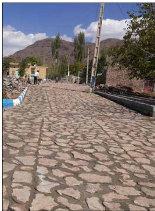
عکس شماره ۴

قبرستان جدید (عکس شماره ۴) و گورستان قدیم (عکس شماره ۵) هنزا نیز همسایه یکدیگر هستند. کارگران شهرداری را می بینم که در حال سنگ فرش کردن گذرگاه های قبرستان هستند. گورستان قدیم به همان شکل قدیم باقی مانده است. کف گورستان، خاکی است. همراه با سنگ قبرهایی قدیمی با نمادهای مذهبی و سنگ هایی با شکل های مختلف که برای جلوگیری از ناپدید شدن قبرها بر بالای سر سفرکردگان آخرت قرار دارند.