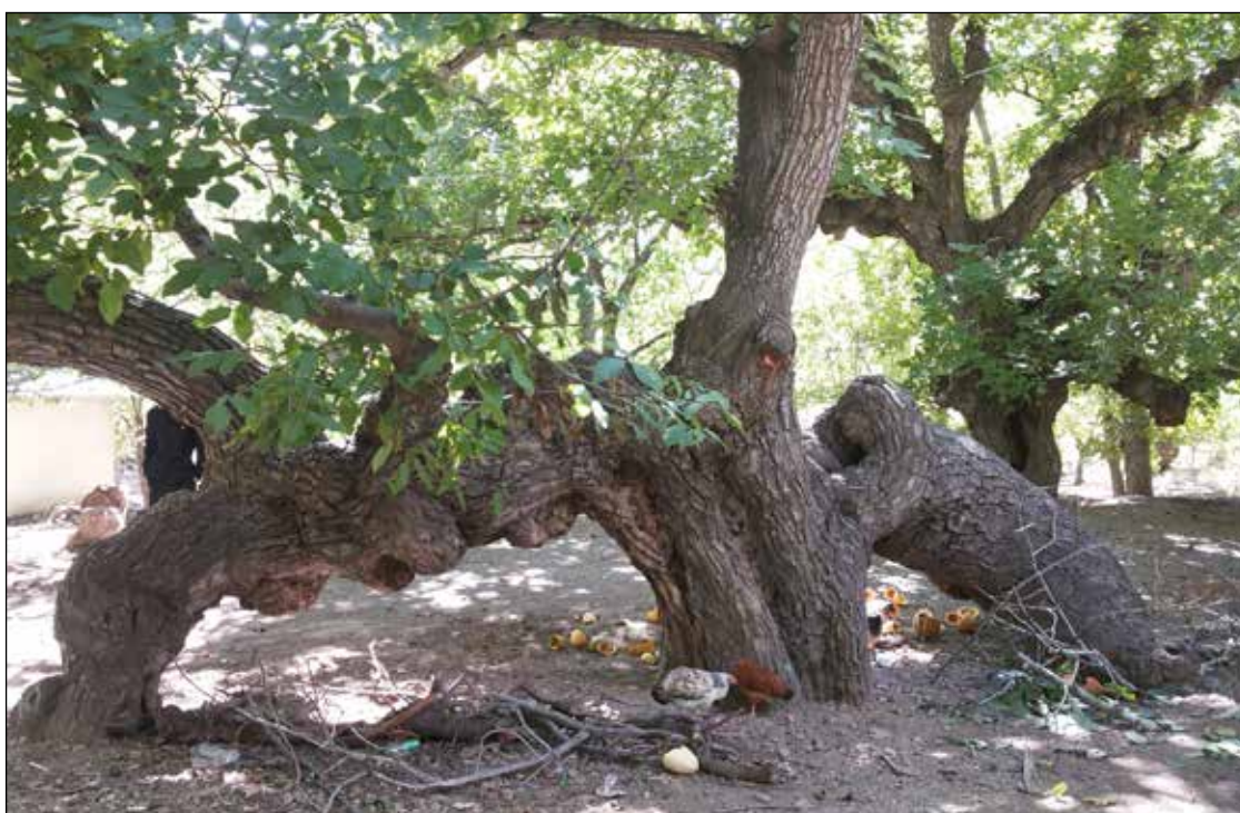
عکس شماره ۷

سفر ما به هنزا از ششم تا ظهر نهم محرم به زول انجامید. هفتم محرم عده ای از مردان مقیم این شهر در قالب هیأت های سی، چهل نفره از ساعت های ۲ بعد از ظهر کوچه پس کوچه های هنزا را زیر پا می گذارند. سینه می زنند و نوحه می خوانند. یک نفر هم علمدار هیأت می شود. علم را کوچه به کوچه و خانه به خانه می برند. هر کس نذر داشته باشد، پارچه یا آینه ای را به علم، آویزان می کند. این روند تا اذان مغرب ادامه دارد. بعد از اذان نیز در مسجد جامع هنزا مراسم عزاداری با حضور زنان و مردان شهر تا پاسی از شب ادامه دارد.