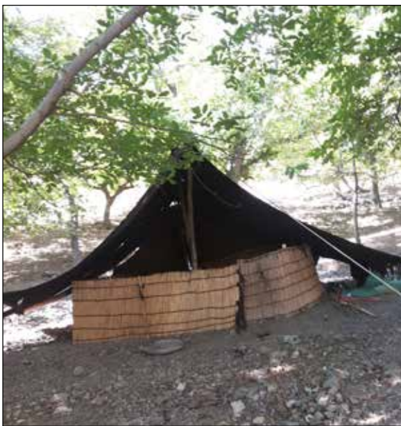
عکس شماره ۶