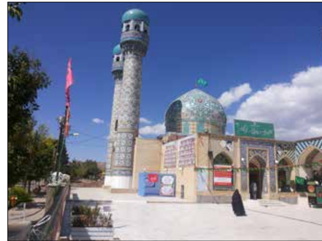
عکس شماره ۱