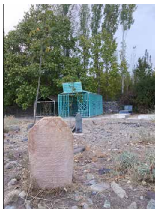
عکس شماره ۵

در منطقه بندر هنزا آن قدر درختان گردو چشمگیر هستند که نمی دانم از کدام یک عکسبرداری کنیم. در حد توانم از درختانی که فکر می کنم زیباتر هستند عکسی می گیرم و باز می گردم.