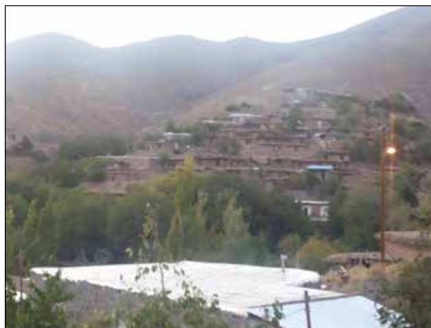
عکس شماره ۲

عشایر به طور پراکنده در اطراف این شهر کوچک و دنج دیده می شوند. عده ای از عشایر استان کرمان، تابستان خود را در هنزا می گذرانند. سایه چادرهای (عکس شماره ۶) برپا شده در سایه سار درختان گردو در شهر و بندر هنزا گویای این بیلاق پرشور است. عشایر باره های خود از اوایل بهار به منطقه سردسیر هنزا می آیند. ابتدا در ارتفاعات سکنی می گزینند و با سرد شدن هوا به تدریج بار و بنه شان را به شهر نزدیک تر می کنند. تا جایی که ماندن در منطقه برای شان غیر ممکن می شود. آن وقت است که باید دل از طبیعت هنزا بکنند و به سکونت در طبیعت جنوب استان دل خوش کنند.