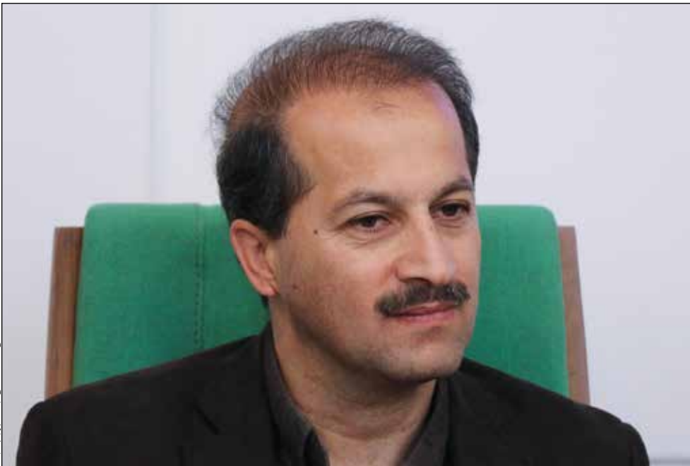
عکس: هادی کارباشی رئیس فدراسیون کوهنوردی و صعودهای ورزشی

ظرفیت بالای کوهنوردی استان و تجربیات و توانایی های خوبی که آقای ایران منش در این زمینه دارند، زمینه را برای عضویت کرمان وشخص آقای ایران منش در این کمیسیون فراهم شود تا روز به روز شاهد پیشرفت و ترقی ورزش کوهنوردی در سطح استان و ایران باشیم. در بخش پایانی مراسم افتتاحیه اسرافیل عاشورلی، رئیس آذربایجان کمیسیون جوانان اتحادیه جهانی کوهنوردی ضمن ابراز خوشحالی از حضور در ایران و کرمان و بازدید از فضاهای سنتی و زیبای ایرانی، اظهار داشت: ایران کوهنوردان معروف و سطح بالایی دارد که به طور مثال بارها صعودهای بالای ۸ هزار متر را بدون تجهیزات و امکانات انجام داده اند که این ها همه از وضعیت خوب ایران در کوهنوردی است، ضمن اینکه درخوردی هم ایران ورزشکاران خوب و درجه یکی را دارد که نشان از حمایت خوب فدراسیون و دولت ایران از این ورزش است که از همه آنها و اعضای فدراسیون تشکر می کنم. محمودهاشمی، عضو هیئت رئیسه کمیسیون جوانان اتحادیه جهانی کوهنوردی در مورد این اجلاس عنوان داشت: این مجمع عمومی با حضور اعضای خود از آلمان، اسپانیا، ایران و آذربایجان برای انتخاب رئیس و نایب رئیس جدید این کمیسیون با نامزدهایی از ایران و انگلستان برگزار خواهد شد.