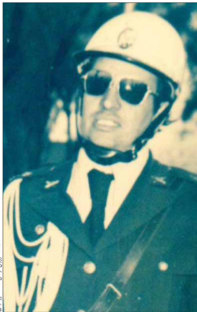
سید علی اکبر سیستانی

وی در ادامه می گوید که در سال ۵۸ کارم در کرمان را شروع کردم. جمعا ۳ یا ۴ نفر در راهنمایی و رانندگی بودیم. جمع پرسنل ۲۰ نفر هم نبود. ۳ دستگاه ماشین داشتیم. اداره راهنمایی و رانندگی چهارراه کاظمی مقابل دادگستری بود. محل فعلی راهنمایی و رانندگی را نیز (بلوار جمهوری اسلامی) بعدا من با همکاری تیمسار هاشمیان رییس شهربانی آن