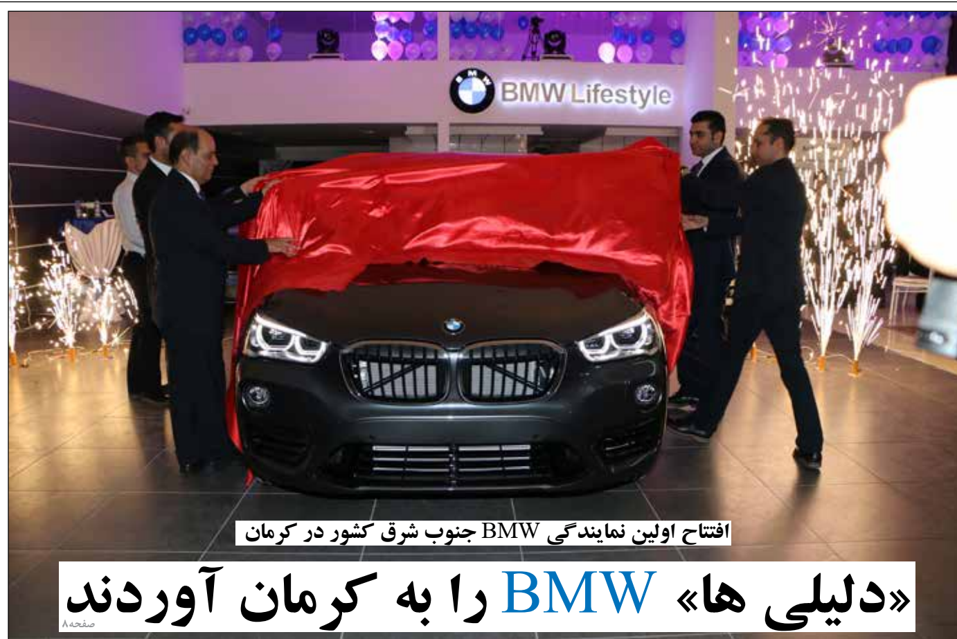
افتتاح اولین نمایندگی BMW جنوب شرق کشور در کرمان

تندبادی که عصر گذشته کرمان را درنوردید، امروز هم مهمان کرمانی‌هاست. بعدازظهر روز گذشته بود که مردم اکثر مناطق استان کرمان شاهد وزش باد بودند. به‌طوری‌که در شهر کرمان سرعت وزش باد تا ساعت ۱۶ به ۱۰ کیلومتر بر ساعت رسیده بود. البته سرعت باد در شهر کرمان نسبتاً از سرعت وزش باد در دیگر شهرها کمتر بود. به‌طوری‌که بر اساس اطلاعات موجود در پایگاه اطلاع‌رسانی اداره کل هواشناسی استان، سرعت وزش باد در لاله‌زار با ۳۵ کیلومتر بر ساعت بیشترین سرعت در مقایسه با دیگر شهرها بوده است. روز گذشته سرعت وزش باد در شهرستان زرنند ۲۱ کیلومتر بر ساعت، در شهرستان‌های سیرجان و بافت ۱۷ کیلومتر بر ساعت، در شهرستان‌های انار، شهرابک و کهنوج ۱۴ کیلومتر بر ساعت و در شهرستان رفسنجان همانند کرمان ۱۰ کیلومتر بر ساعت بود. در جیرفت وزش باد آرام گزارش شد و اطلاعاتی از وضعیت جوی بم در سایت هواشناسی کرمان موجود نبود. صفحه ۲