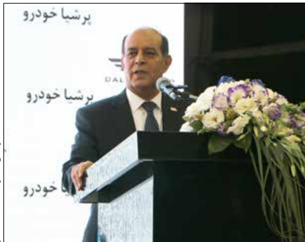
کوشش مدیر شبکه نمایندگان