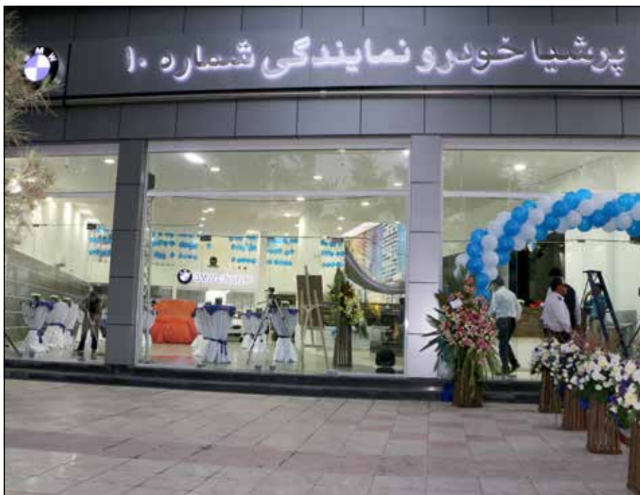
تصویری از سردر نمایندگی پرشیا خودرو