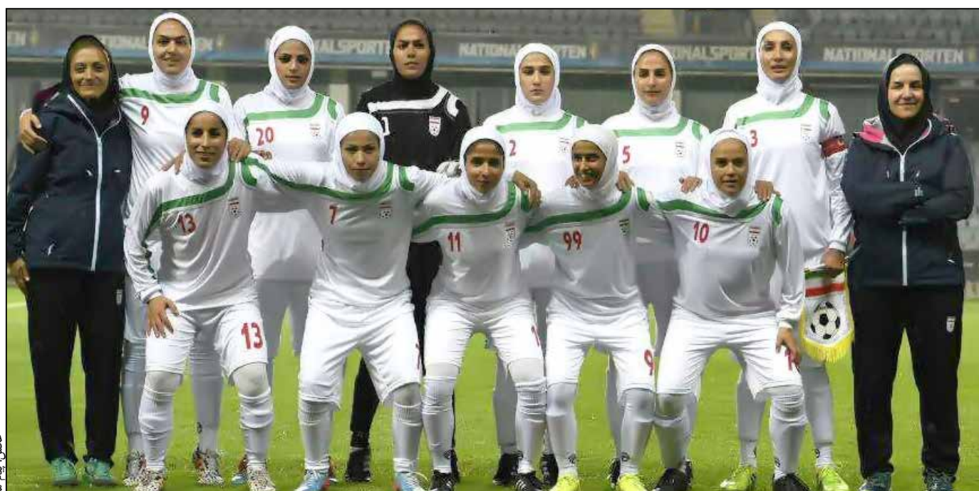
نخستین تجربه دختران فوتبالی استان کرمان در قالب تیم ملی ایران