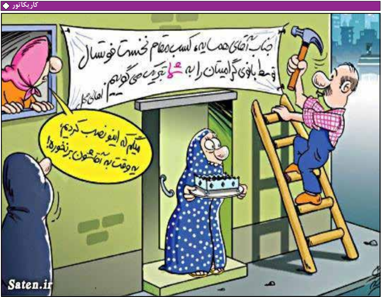
در حاشیه دیدار فوتبال بانوان ایران و تیم ملی سوئد