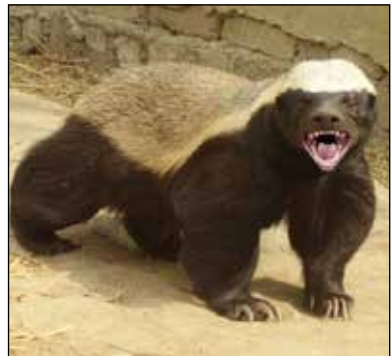
گورکن عسل خوار

دستها و پاها نسبتا بلند و باریک با پنجه های گرد و چنگال های قوی و تیز و خمیده است. چنگالها قابل جمع شدن بوده و غلاف آنها رشد کرده است. موهای بدن نرم و انبوه و موهای زیرین کرکی و فراوان هستند. رنگ کلی بدن در پشت از قهوه ای خاکستری روشن تا خاکستری روشن تغییر می کند. این گربه وحشی به ظاهر شبیه به گربه های اهلی معروف به گربه پلنگی هستند.