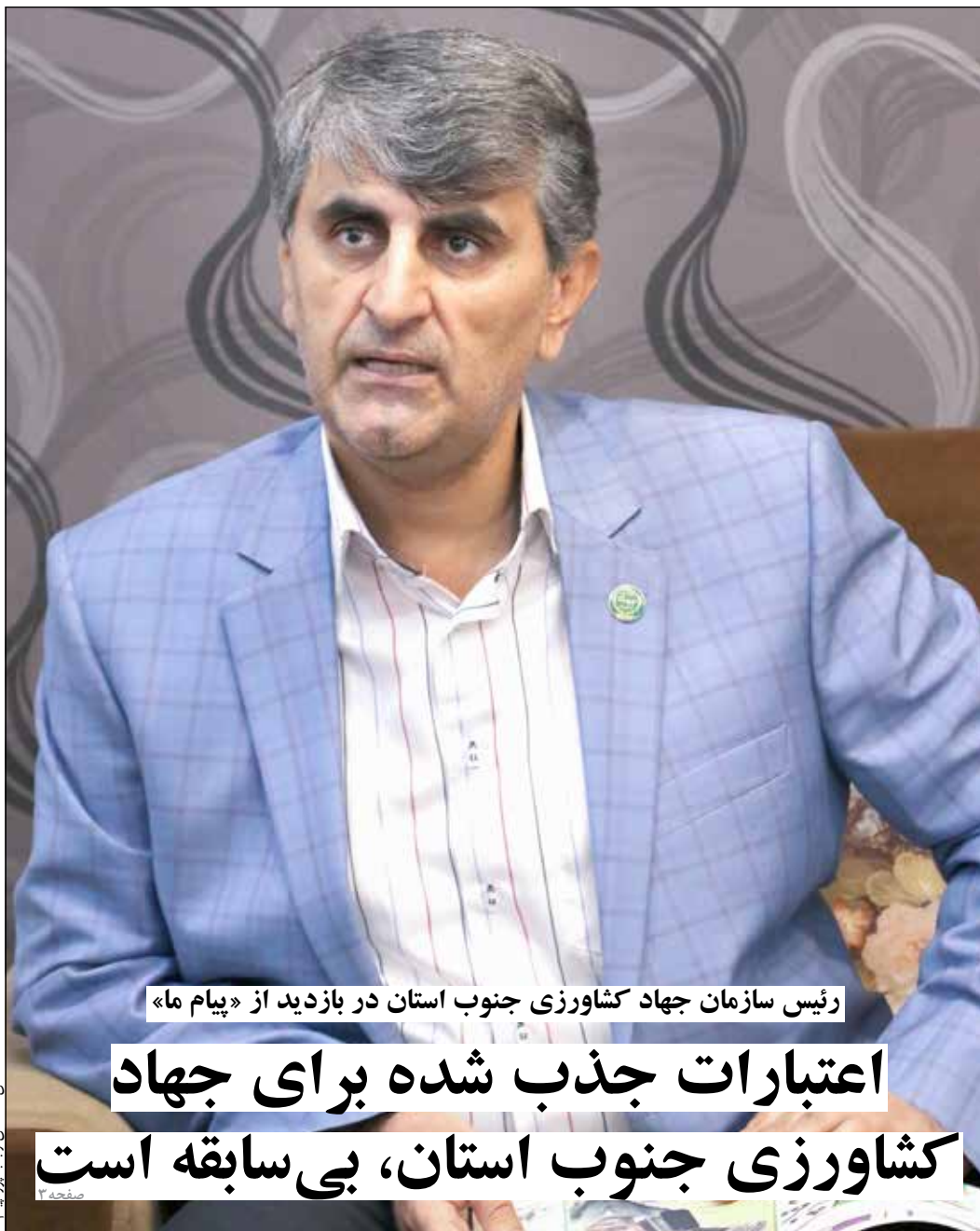
رئیس سازمان جهاد کشاورزی جنوب استان در بازدید از «پیام ما»