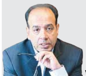
نایب رئیس اتاق بازرگانی ایران: