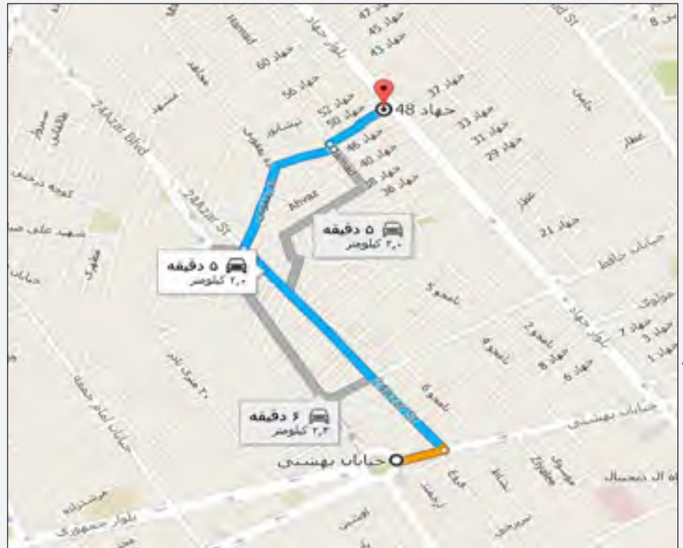
وضعیت ترافیک مسیر میدان آزادی تا دفتر روزنامه پیام ما در کرمان