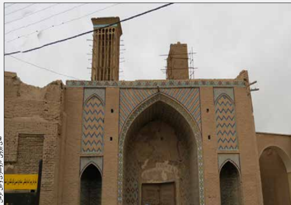
بنای هروی از بناهای کاروانسرای وکیل کرمان

نیستند؛ اما خدمات شایانی برای کرمان انجام داده اند. وی مدت ۹ سال بر کرمان حکومت کرد و از ایشان سه فرزند به نام های میرزا حسینخان اسفندیاری ملقب به سردار نصرت و میرزا رستم خان اسفندیاری (رفعت الدوله) و محمدرضا اسفندیاری (عدل السلطان) متولد گردیدند که هر سه این پسران بعد از خودش در شمار سرمایه