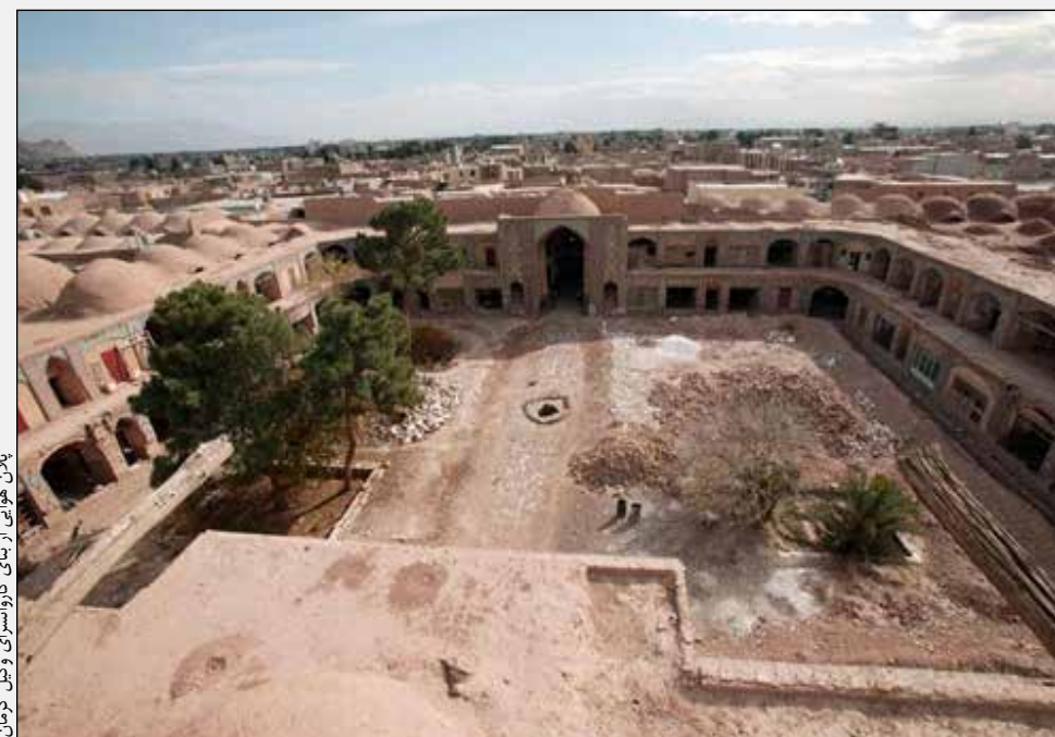
بنای هروی از بناهای کاروانسرای وکیل کرمان