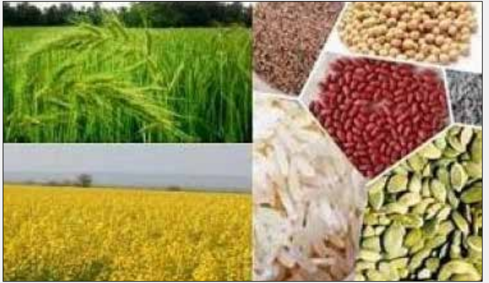
تاریخته اختصاص داده شده اند.

ادعای گروه ذی نفوذ کشاورزی با محصولات تاریخته (ISAAA) که استفاده از چنین بذرهایی را به ویژه کمک بزرگی به کشاورزی‌های کوچک با