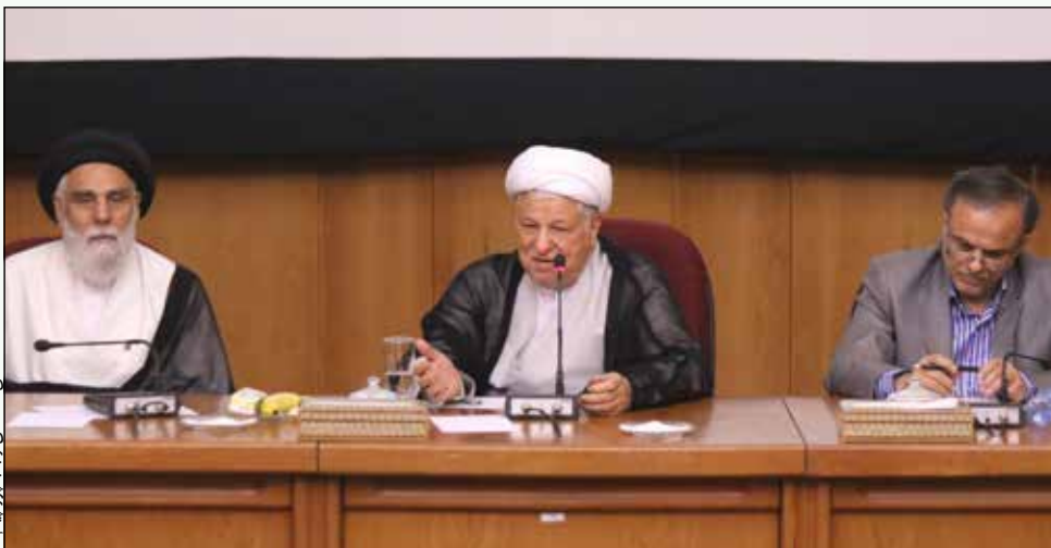
قبل از برجام هواپیماهای ما برای سوخت‌گیری هم مشکل داشتند

رئیس مجمع تشخیص مصلحت نظام گفت: «بسیاری از مردم دستاوردهای برجام را نمی‌دانند و عده‌ای نیز القا می‌کنند که مذاکرات دستاوردی نداشته است و با تبلیغات نادرست، ذهن مردم را فریب می‌دهند. درحالی‌که قبل از این حتی هواپیماهای ما برای سوخت‌گیری با مشکل مواجه بودند.» آیت‌الله هاشمی رفسنجانی افزود: «دستاوردهای برجام این‌قدر هست که بتوانیم به آن افتخار کنیم. کار دولت در این زمینه بسیار مبنایی و درست بود. خوشبختانه توانستیم با مذاکرات هسته‌ای، مشکلات هواپیمایی و تحریم فروش نفت را رفع کرده و بازاری را که از دست داده بودیم، دوباره باز پس بگیریم. در حال حاضر بسیاری از بانک‌های دنیا با ما همکاری می‌کنند. دولت کار اساسی کرد و تحریم‌ها را شکست و این کار هنوز جریان دارد.» وی افزود: «البته ما باید گام‌به‌گام پیش رویم تا طرف‌های مذاکره خیال نکنند به ما امتیاز داده‌اند بلکه این‌ها چیزهایی است که حق طبیعی ما بوده که به بهانه ساخت مسبب هسته‌ای جلوی آن‌ها را گرفته بودند. درحالی‌که مقام معظم رهبری ساخت مسبب اتم را حرام اعلام کردند.»