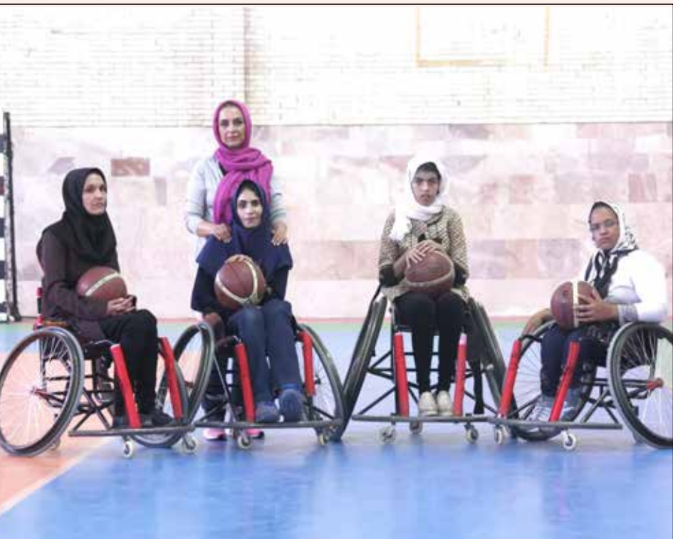
سوم کشوری را در مشهد کسب کرد و در مسابقات لیگ کشوری در پهن ماه هم به اردوی انتخابی تیم ملی دعوت می‌شود و حالا منتظر است تا با اعلام فدراسیون ورزش های جانبازان و معلولان، زمان برگزاری اردوی تیم ملی اعلام شود.

این ۶ نفر تنها بازیکنان تیم بسکتبال با ویلچر کرمان است که با پشتکاری خوب و اراده ای والا، کمپوها را پشت سر گذاشته اند و امیدوارند با همت مسئولان و کمک های خیران ورزشی، بزرگترین مشکل آنها که همانا وسیله نقلیه و سرویس رفت و آمد است را حل و فصل نمایند. در هر صورت اگرچه به نظر می‌رسد، تیم بسکتبال با ویلچر کرمان مظلوم واقع شده ولی روحیه همبستگی و جوش صمیمانه و شادی که در ساعات تمرین بر سالن حاکم است، به گونه توصیف ناشدنی روح را جلای تازه ای می‌بخشد. زمانی که بچه های پر انرژی و کم توان با فراغ دل و بدنی خستگی ناپذیر، توپ را با دستان ظریف و نازک خود را بر روی حلقه سخت ویلچر می‌سایند از شادی سرشارند و ساعاتی را بدون اندیشیدن به کمپوها و ناملایمت ها با عشق در کنار هم سپری می‌کنند، در این حال به این می‌اندیشیم که آیا می‌شود آستین همتی بالا زد و گوشه ای از مشکلات این بانوان قوی و نجیب را کم کرد؟