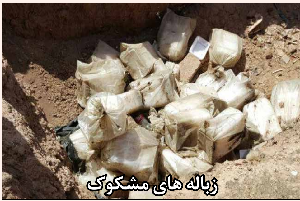
زباله های مشکوک