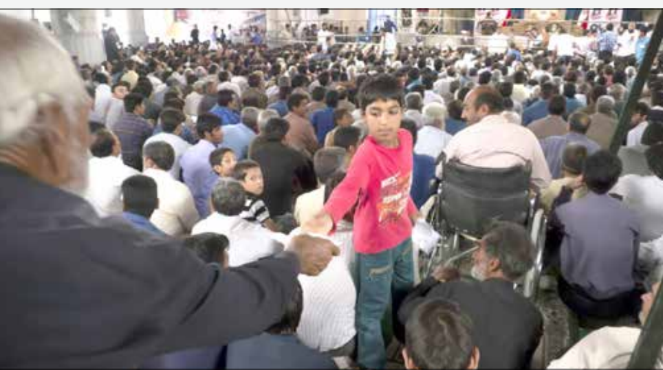
یکی از استقبال کنندگان سن در حال دادن نامه به کودکی که کوبی این سولیت را به دوش داشت

اینجا بیشتر خرید و فروشها با کارت یارانه‌است و واقعا تاثیر بسزایی در منطقه‌ی عنبرآباد داشته و برای اثبات این مدعا مرا به کنار دخل مغازه برد و کشویی را باز کرد و یک‌دسته هجیم از کارت‌های عابر بانک را نشانم داد و گفت می‌بینی این‌ها همه کارت یارانه‌ی مردم هستند که بواسطه‌ی نداشتن پول کافی برای خرید این کارت‌ها را می‌گذارند و مثلاً می‌گویند این کارت یارانه‌ی ۲ نفر است تو این کارت را بگیر و به اندازه‌ی ۱۸۰ هزار تومان به ما جنس بده این هم رمز کارت وقتی دوماه دیگر دوبار یارانه‌ی ما دونفر را از کارت برداشتی و با هم بی حساب شدیم آن زمان می‌ایسم و دوباره به هم روش خرید می‌کنیم و این داستان همیشه در حال تکرار شدن است اینجا که پول و اشتغال نیست داستان زندگی مردم شده داستان انتظار برای روز واریز شدن یارانه مثلاً آن سوپر مارکت را می‌بینی که صاحبش نشسته جلوی مغازه و مشتری ندارد؟ کسی از او خرید نمی‌کند چرا که جنس نسیه نمی‌فروشد) امیدوارم که متوجه موقعیت شده باشید که وقتی شایعه می‌شود کسی ۲۵۰ هزار تومان یارانه می‌دهد در مناطق محرومی که اشتغال کمترین نیاز مردم آن مناطق است چقدر این مبلغ زیاد و تاثیر گذار است و چقدر راحت می‌شود دست روی نقطه‌ی ضعف مردم گذاشت و از شکست‌های ایشان برای خود موفقیت تراشید.