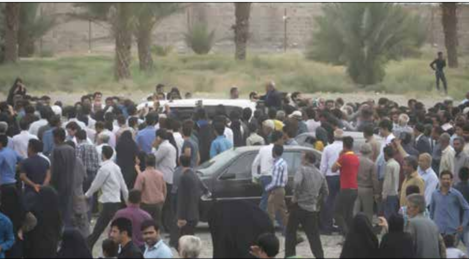
احمدی‌نژاد در حال خروج از مصلی و مردم کنار ماشین در حال تقدیم نامه به او

طرف یعنی که با بی‌عملی خود ما هم طرف ظالم را گرفته‌ایم از آغاز رسیدن به مصلی جیرفت روایت را شروع می‌کنم: مردم از چپ و راست می‌آمدند و تمام خیابان‌های اطراف را ماشین‌های پارک شده قرق کرده بودند و درهای کوچکی که برای ورود مردم در نظر گرفته بودند آنقدر عریض بودند که دو نفر با هم می‌توانستند وارد بشوند و پرسنلی که وظیفه‌ی حفظ امنیت مراسم را به عهده داشتند می‌توانستند هر کس که وارد می‌شود را خوب تفتیش بدنی بکنند که خدای ناکرده کسی با