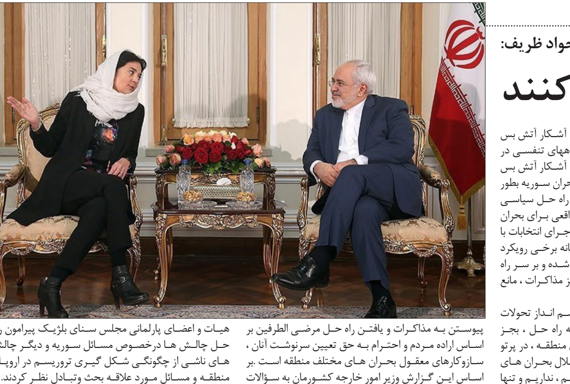
پیوستن به مذاکرات و یافتن راه حل مرضی الطرفین بر اساس اراده مردم و احترام به حق تعیین سرنوشت آنان، سازوکارهای معقول بحران های مختلف منطقه است. بر اساس این گزارش وزیر امور خارجه کشورمان به سوالات

وزیر امور خارجه گفت: جمهوری اسلامی ایران تعهدات خود را (در قبال برجام) بطور جدی اجرا کرده است و از شرکای ۱+۵ انتظار می رود تا به مسئولیتهای خود در زمینه اجرای دقیق تعهداتشان عمل کنند. به گزارش ایرنا محمد جواد ظریف در دیدار کریستین دوفرین رییس مجلس سنای بلژیک آخرین راههای گسترش روابط دوجانبه و مسائل منطقه ای را با وی مورد بحث و تبادل نظر قرار داد. وزیر امور خارجه اظهار داشت: حضور هیات پارلمانی مجلس سنای بلژیک در تهران، جایگاه مهمی در گسترش مناسبات دو کشور دارد و نقش پارلمان های دو کشور در تدوین و وضع قوانین و سیاست های دو کشور اهمیت فوق العاده ای داشته و دارد. محمد جواد ظریف با تشریح آخرین وضعیت توافق برجام خاطرنشان داشت: جمهوری اسلامی ایران تعهدات خویش را بطور جدی اجرا کرده است و از شرکای ۱+۵ انتظار می رود تا مسئولیت های خویش را در قبال اجرای دقیق تعهدات خویش بعمل آورند. وزیر امور خارجه در ادامه با بیان اینکه در زمینه تروریسم، افراط گرایی، مخاطرات و چالش های مشترک در سطح جهانی و منطقه داریم اظهار داشت: بررسی گزرای عمده اعمال تروریستی و مجریسان آن، بدرستی استنتاج می گردد تماماً این رویکردها از یک منبع و فکر الهام می گیرند و تغییر این چالش نیز در گرو توجه به تغییر رفتارها و رویکردهای منابع تغذیه کننده افکار افراطی و تروریستی می باشد. ظریف در خصوص ضرورت تحرک بخشیدن به مناسبات اقتصادی و بانکی اظهار داشت: ما امیدواریم شرکای اروپایی بطور ملموس و واقعی در جهت تحرک بخشیدن به فعالیت های بانکی و مالی اقدام نمایند تا مرادوات دو کشور شاهد آثار آن بطور عینی باشند. وزیر امور خارجه کشورمان در خصوص بحران سوریه گفت: ما در بحران جاری سوریه شاهد رویکردهای خصمانه با کارشنکی های