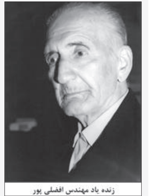
زنده یاد مهندس افضل‌پور

در پایان مبحث دانشگاه کرمان، جهت ارج نهادن به نیت و عمل خیرخواهانه‌ی زنده‌یاد مهندس علیرضا افضل‌پور و همچنین تمام بزرگوارانی که در انجام این طرح عظیم، با فکر، قلم، قدم و اعتبار خویش، منشأ خدمتی بوده‌اند، همچون آقایان: