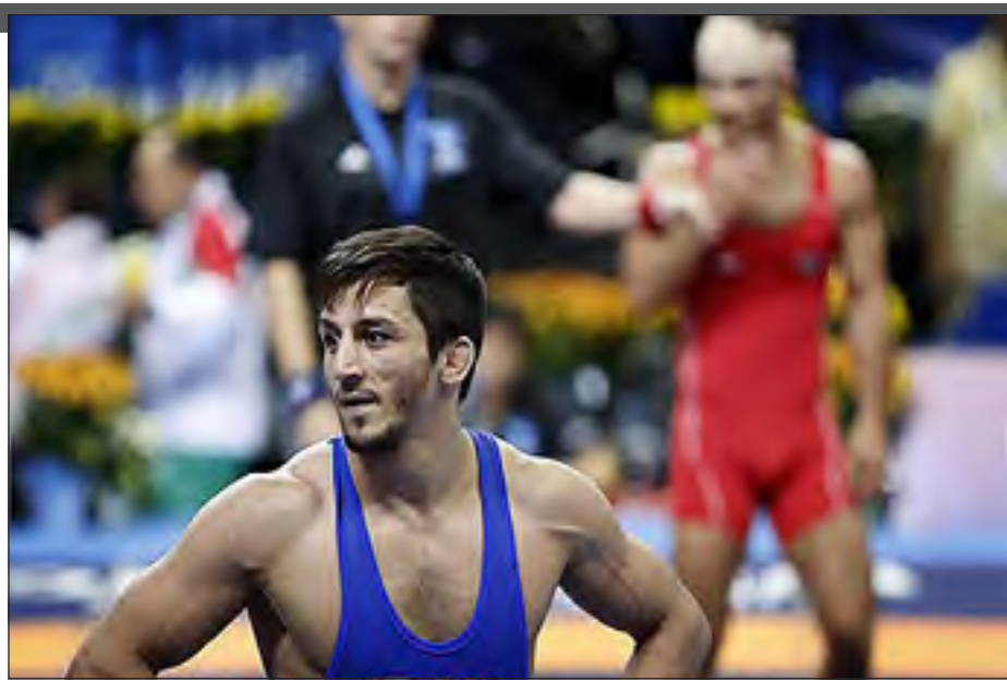
مدال طلا (۳ طلای المپیک ۱۹۸۸، ۱۹۹۲ و ۱۹۹۶ و ۹ طلای جهان) والری رزانتسوف از شوروی سابق با ۷ مدال طلا (۲ طلای المپیک ۱۹۷۲ و ۱۹۷۶ و ۵ طلای جهان) در جایگاه سوم قرار دارد.