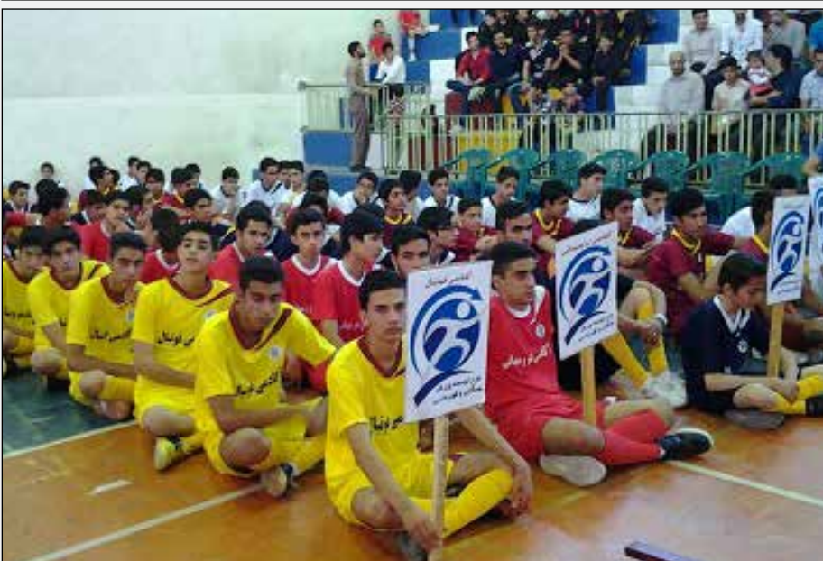
مشخص و ضمن برگزاری اردوها و استفاده از وجود مربیان مجرب ورزشکاران با آمادگی کامل می توانند در مسابقات آسیایی، جهانی و بین المللی شرکت نمایند. وی خاطر نشان کرد: با توجه به ظرفیت های سخت افزاری در کوهنجان هفت

آکادمی قهرمانی راه اندازی شده که دو آکادمی فوتسال و والیبال ویژه دختران و ۵ آکادمی فوتبال، والیبال، کاراته، کشتی و دو میدانی ویژه پسران می باشد و در این طرح ۱۴۲ ورزشکار کوهنجان تحت حمایت قرار می گیرند.