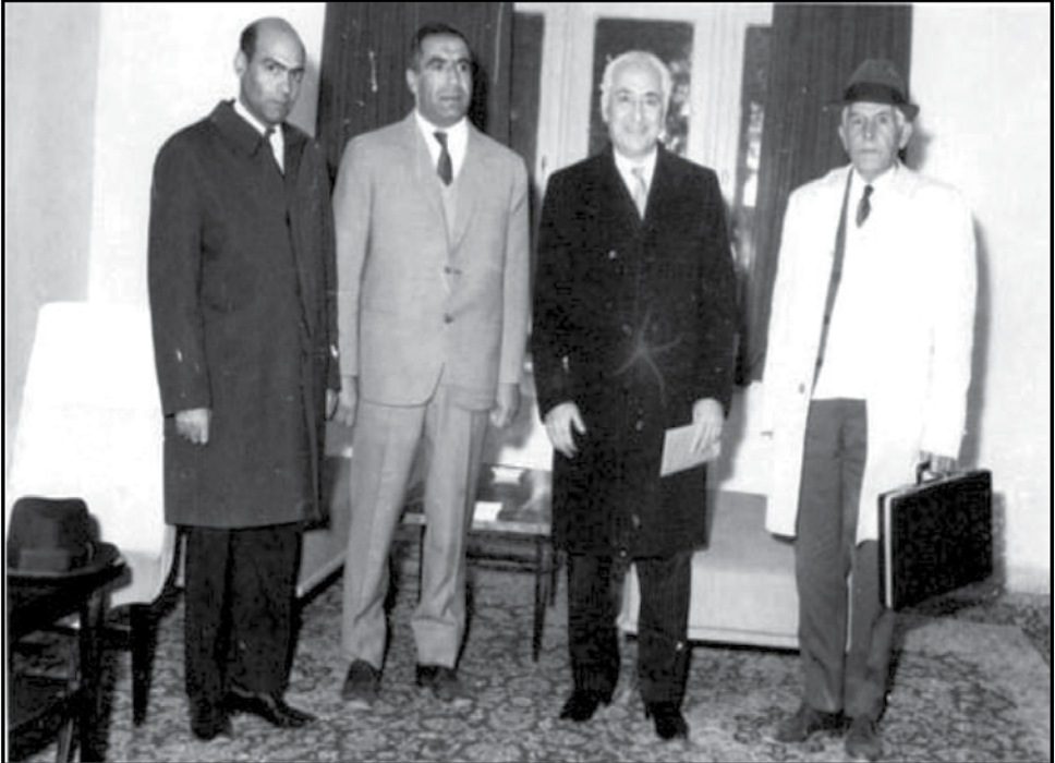
سناتور عباس مسعودی در سفر به کرمان - دی ماه ۱۳۴۷ از راست به چپ: مرحوم حسین فاتح (مدیر مسئول روزنامه فاتح) - عباس مسعودی محمد صنعتی - مهدی باختر (سرپرست روزنامه اطلاعات در کرمان)

عباس مسعودی که خود مبدع تأسیس هیئت های مشورتی روزنامه اطلاعات در سراسر ایران بود، در دی ۱۳۴۷ جهت آشنایی بیشتر با مشکلات این ناحیه و دیدار با اعضای هیئت