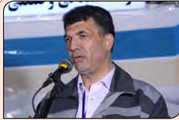
عباس دعاگوی: این نمایشگاه فتح بابی برای بومی سازی قطعات در استان است

کسی را محکوم و متهم یا تشویق کنیم. این یک واقعیت تلخ است که معادن ما هم در حوزه ذغال سنگ و مس و هم سنگ آهن و کرومیت در توسعه اقتصادی استان همکاری نمی کنند. شرکت هایی که تاسیس شده اند معادن استان کرمان را از استان خارج میکنند و این امر باید تغییر کند. وی ضمن اشاره به ۶۵۰۰ مورد اعتصاب کارگری از اول سال تا کنون در باره گستره این خروج سرمایه گفت: ما با مدیر عامل مس در مورد ۲ میلیارد دلار ذخیره مس صحبت داشتیم که دارد به صورت کنسانتره از شهر خارج می شود و این کاملاً خلاف رویه اقتصاد مقاومتی است. رزم حسینی اضافه کرد: ممکن است در شروع کار در جاهایی مقاومت شود ولی این سیاستی راهبردی و خیر خواهانه است. من میتوانم وارد این حوزه ها نشوم ولی نیامده ام در دولت و قلم را تلف کنم. ما باید کرمان را با کمک یکدیگر بسازیم. اکثر روستاهای کنار معادن به علت آلودگی دام ها و هوا تخلیه شده اند. شما کرمانی هستید و باید کرمان را با استفاده از اقتصاد مقاومتی بسازید. ما نمی توانیم بپذیریم که از جاده استان کرمان به عنوان مسیر تخلیه معادن استفاده شود و مردم در کناره فقیر باشند.