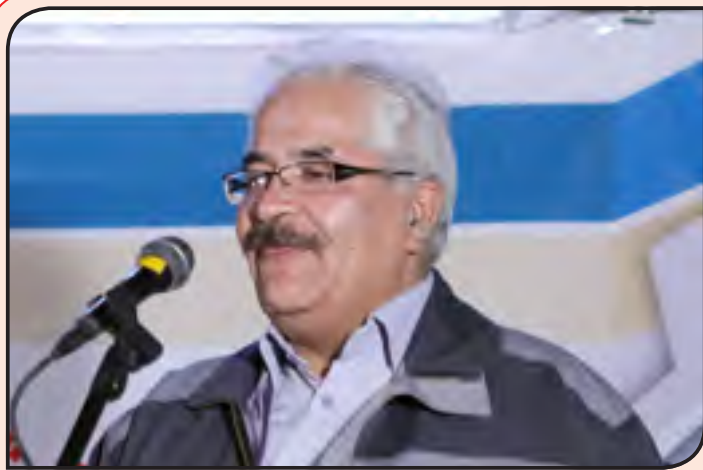
مدیرعامل شرکت معدنی و صنعتی گل گهر: دین گل گهر رواج فرهنگ صنعتی شدن است