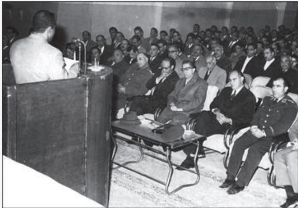
دومین جلسه عمومی پیرامون تشکیل شرکت اتوبوسرانی کرمان - ۱۳۴۴ ش. سخنران: محمد صنعتی - ردیف اول (از راست): سرهنگ ابوذری (رییس شهربانی) سعیدی فیروزآبادی (استاندار کرمان) - مکان: باشگاه افسران

«به دعوت هیئت مؤسس شرکت اتوبوسرانی کرمان، نمایندگان طبقات مختلف مردم در جلسه ای که با حضور آقای سعیدی فیروزآبادی استاندار کرمان در سالن اجتماعات دبیرستان