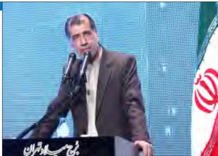
نایب رییس مجلس شورای اسلامی گفت: استاندار و مسوولان استان کرمان همت بالایی دارند و همانطور که در بسیاری از شاخص‌ها رتبه اول کشور را داریم، انشالله، شاخص اشتغال در استان

همواره و در تمام دوره‌ها از متوسط رشد اقتصادی کشور بیشتر بوده و این مدیون امکانات طبیعی کرمان است و مهم‌تر از آن مدیون نیروی انسانی باهوش، پرتلاش و آینده‌نگر و بصیر بوده است. وی با اشاره به ظرفیتهای استان کرمان در حوزه صنایع و معادن افزود: ظرف سه سال آینده چندین میلیون تن تولید فولاد در استان خواهیم داشت این در حالی است که طی ۱۲ سال گذشته همواره رنج می‌بردیم که کرمان دارای بزرگ‌ترین معادن زغال و آهن است، اما متأسفانه هیچگونه تولید فولادی در این منطقه وجود نداشت. باهنر تصریح کرد: با همت مدیران گذشته این کار