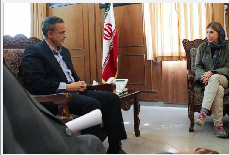
دیدار سفیر نروژ با استاندار کرمان