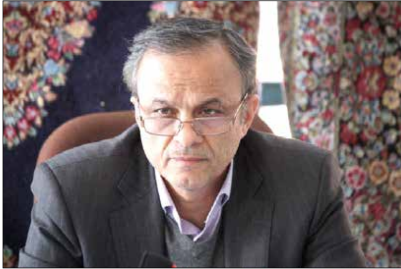
در اقتصاد مشارکتی، هم مردم مسئولیت بیشتری در اداره امور جامعه و در تامین رفاه و استقلال مادی خود می پذیرند و هم

در پی خلق حماسه سیاسی در خرداد سال ۱۳۹۲ توسط شما مردم فهیم و انقلابی، هم اکنون با توجه به شرایط حساس کشور وظیفه داریم در جهت خلق حماسه ای دیگر در حوزه فعالیت های اقتصادی که از الزامات و نیازهای اساسی مردم است، همتی بلند و تلاشی مضاعف داشته باشیم. تحول در بهبود معیشت مردم، پاسخگویی به نیازهای شغلی جوانان، مقابله با تحریم ها، تامین امنیت کشور با نیل به خوداتکایی و استقلال، کاهش وابستگی های کشور به درآمدهای نفتی و واردات، رونق تولید ملی و حرکت شتابنده در مسیر دستیابی به اهداف چشم انداز که همگی از توصیه های موکد رهبر معظم انقلاب هستند، از طریق توجه همزمان به دو مسئله زیر قابل تحقق می باشند: ۱- تامین و توسعه زیرساخت ها توسط دولت و پرهیز از دخالت مستقیم دولت در انجام فعالیت های اقتصادی ۲- مردمی کردن اقتصاد و ترویج فرهنگ کارآفرینی