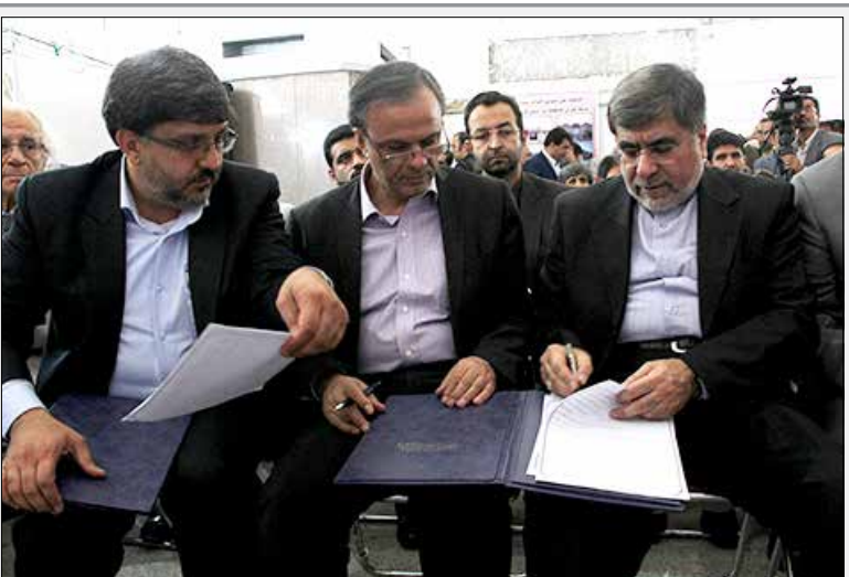
دو تفاهم نامه بین استاندار کرمان و وزیر ارشد