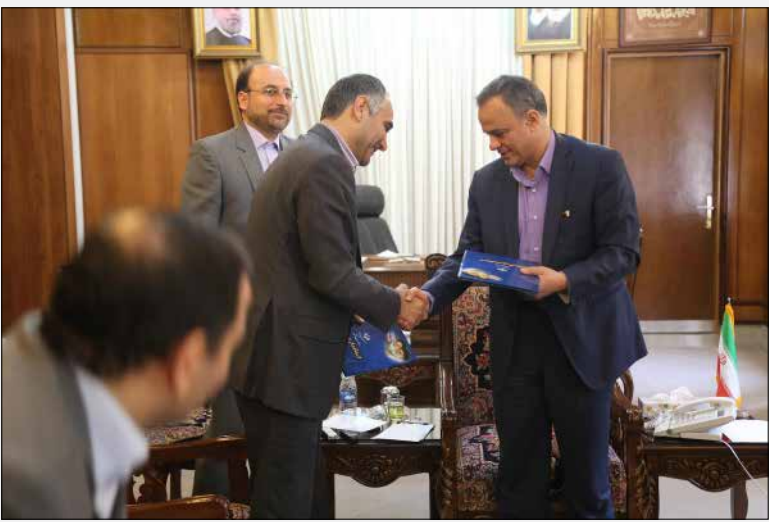
تفاهم نامه همکاری بین استانداری کرمان و صندوق بیمه اجتماعی کشاورزان، روستائیان و عشایر

ادامه از صفحه قبل اجرای طرح مثلث توسعه اقتصادی که برگرفته از استراتژی توسعه اقتصاد مشارکتی در استان می باشد. ملزومات خاصی از می طلبد. باور و عزم راسخ مسئولان به اجرای آن و هماهنگی سازنده و موثر بین ارکان حکومتی و مردم مهم ترین شروط موفقیت در جهت تحقق مطلوب اجرای این طرح است. مثلث توسعه اقتصادی نحوه ارتباط و چگونگی تعامل عوامل پشتیبان توسعه اقتصادی در هر ناحیه را با سرمایه گذاران مشخص می سازد. از کارکردهای اصلی این مثلث تأمین امنیت سرمایه، آماده سازی زیر