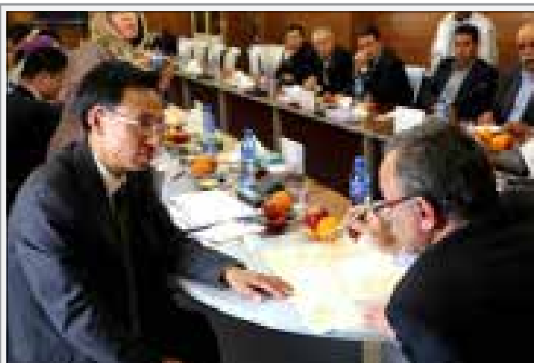
دیدار سفیر چین با استاندار کرمان