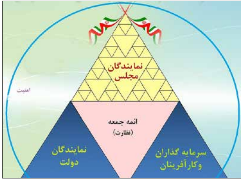
دولت به جای نقش مداخله ای در اقتصاد، کارکرد نظارتی و هدایتی خود را به دنبال می نماید. بنابراین در این استراتژی، برنامه

چنانچه دولت در حوزه اقتصاد فقط نقش خود را در بسترسازی، تسهیلگری و نظارت بداند با اعتماد به بخش غیردولتی، مردم فرصت خواهند یافت تا مسئول معاش خود بوده و با افزایش تمکن مالی، خود را از کمک های نقدی دولت بی نیاز بدانند. به تعبیر آقای دکتر روحانی رئیس جمهور محترم دولت تدبیر و امید، باید تصدی گری دولت کاهش یافته و شرایطی فراهم گردد تا مردم مسئولیت بیشتری در اداره کشور و تامین معاش خود بپذیرند. چنین چارچوبی، زمینه تمکن مالی و دین مداری مردم را نیز تحقق خواهد بخشید. هدف برتر در تمدن اسلامی، پرداخت صرف به مسئله اقتصاد نیست. با اعتقاد به این که اقتصاد با زندگی، دین و فرهنگ مردم در ارتباط است، الویت دهی به برنامه ریزی اقتصادی در کنار توجه به ارزش های معنوی و اخلاقی، هم استعدادهای انسانی را شکوفا می سازد و هم روند توسعه را قوام آورد.