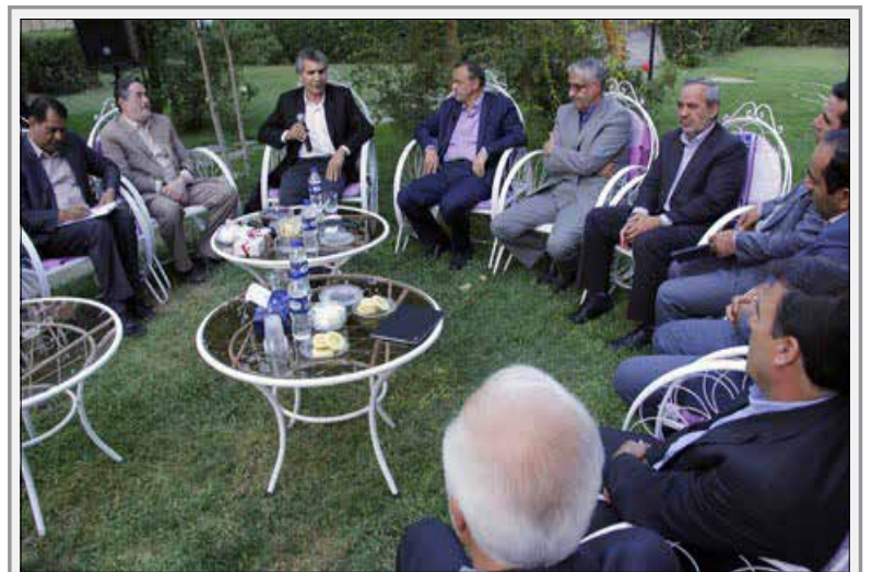
امضای تفاهم نامه احداث پروژه شهر ۶ دروازه آدینه کرمان

گذاری و کارآفرینی ۲- پیگیری در خصوص افزایش سهم اعتبارات تملک دارایی های سرمایه ای استان در قانون بودجه کشور ۳- رایزنی و پیگیری از طریق مسئولان و مقامات کشوری در زمینه طرح و برنامه های اساسی شهرستان ۴- شرکت در جلسات مثلث توسعه اقتصادی جهت هم اندیشی و پیگیری رفع موانع متقاضیان سرمایه گذاری و فعالان اقتصادی ۵- هماهنگی و هم افزایی با نمایندگان دولت به منظور پیگیری حل مشکل سرمایه گذاران در سطح ملی ۶- همکاری در شناسایی و جذب سرمایه گذاران و کارآفرینان به منظور تحرک بخشی به فعالیت های اقتصادی شهرستان ۷- تلاش به منظور چشم در توسعه اقتصادی استان با رویکرد توسعه متوازن درون گرا و پرهیز از نگاه بخشی به توسعه ۸- ارائه رهنمود و مشورت جهت اثربخشی بیشتر کارکرد مثلث توسعه اقتصادی. در شهرستان ها ۱- نظارت عالیه بر عملکرد الگوی مثلث اقتصادی ۲- آگاه سازی بیشتر مردم در زمینه اهمیت پیشرفت اقتصادی با توجه به تأکیدات مقام معظم رهبری ۳- تشویق مردم به کار و تلاش بیشتر اقتصادی به عنوان نوعی ارزش و عبادت ۴- اصلاح رفتار اجتماعی و سبک زندگی مردم از طریق ترویج فرهنگ اسلامی با هدف افزایش میل به پس انداز و سرمایه گذاری و آگاه سازی مردم برای کمک به رشد تولیدات ملی با ترجیح مصرف کالاهای ایرانی به غیر ایرانی ۵- تکریم و حمایت از کارآفرینان و سرمایه گذاران به عنوان تلاشگران و مجاهدان عرصه اقتصاد ۶- ایجاد وحدت و برقراری تفاهم بین مسئولان اجرایی جهت بسیج همه امکانات شهرستان برای رفع مشکلات معیشتی مردم ۷- ارائه رهنمود و مشورت به خدمتگزاران مردم ۸- ممانعت از مباحث حاشیه ای و بی ارزش و آرامش بخشی به فضای عمومی جامعه به منظور بهره گیری از فرصت های خدمتگزاران.