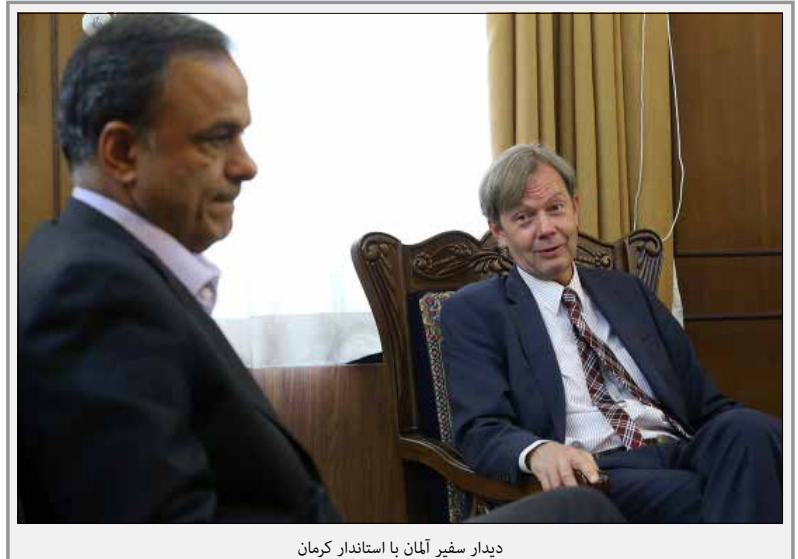
دیدار سفیر آلمان با استاندار کرمان

تشریفات زاید اداری در راستای صرفه جویی در وقت و هزینه های سرمایه گذار ۳-۷- برنامه ریزی برای بازدید مکرر از واحدهای تولیدی توسط نمایندگان ادارات ذیربط به منظور ارزیابی مراحل پیشرفت پروژه و پیگیری لازم در جهت رفع مشکلات احتمالی ۳-۸- برنامه ریزی لازم برای استفاده حداکثری از ظرفیت مناطق ویژه، شهرک ها و نواحی صنعتی برای جذب سرمایه گذار ۳-۹- هماهنگی و پیگیری مستمر امور اجرایی سرمایه گذاران و پیگیری جدی طرح های سرمایه گذاری تا زمان بهره برداری کامل از آنها ۳-۱۰- تلاش برای حمایت و پیگیری اخذ تسهیلات ریالی و ارزی مورد نیاز متقاضیان سرمایه گذاری ۳-۱۱- تشکیل جلسات منظم دوره ای با حضور تمامی عوامل پشتیبان و ارکان تأثیر گذار مثلث توسعه جهت استماع مشکلات متقاضیان سرمایه گذاری و فعالان اقتصادی و چاره جویی در خصوص رفع مشکلات آنها ۳-۱۲- برنامه ریزی و انجام اقدامات لازم برای استقرار سیستم پنجره واحد در گمرکات استان (اجرایی نمودن ماده ۷۰ قانون برنامه پنجم توسعه) ۳-۱۳- اهتمام در جهت حرکت به سمت ارائه خدمات الکترونیکی به سرمایه گذاران در راستای تحقق دولت الکترونیک ۴- آموزش