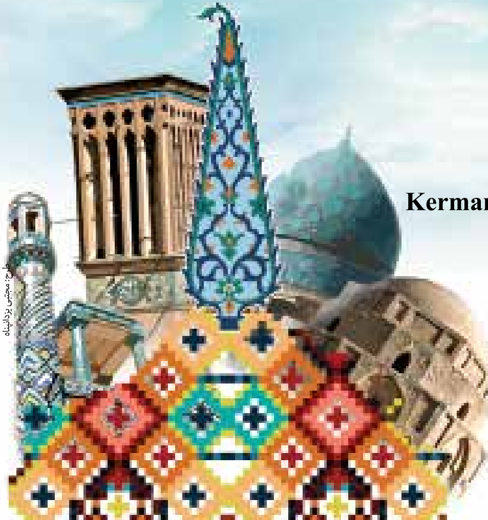
طراح: مجتبی یزدانیانیه

Cultural week has a valuable role in introducing Kerman's high capacities