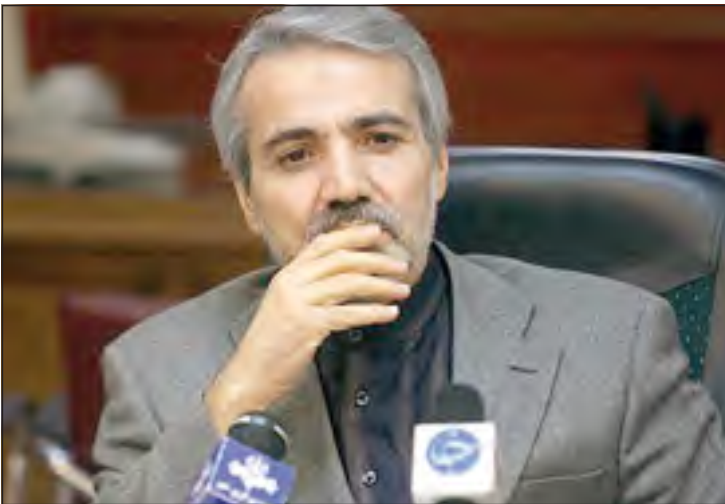
سخنگوی دولت در نشست هفتگی خود با خبرنگاران گفت: قرار نیست که مجلس به این توافق رای بدهد؛ طبق مصوبه مجلس توافق در شورای عالی

در این راه توجه به کار و تلاش بیشتر امری حیاتی و مهم است. بر اساس آنچه آمار ارائه شده مشخص می کند در ایران در هر ۲۴ ساعت به طور میانگین هر نفر فقط و فقط ۲۲ دقیقه در ادارات دولتی و ۲ ساعت در بخش خصوصی کار مفید انجام می دهد، در حالی که کشور ژاپن با ۶ ساعت کار مفید در زمان مورد نظر، در صدر جدول و کشور همسایه مان ترکیه با ۴ ساعت در حال حرکت و رشد می باشند. وقتی این میزان کار و تلاش را در کشور ژاپن به عنوان یک کشور توسعه یافته و حتی ترکیه که در حال رشد اقتصادی است می بینیم به راز پیشرفت اقتصادی آنها پی می بریم. با این میزان زمان کاری مسلماً راه به جایی نخواهیم برد و حتی نمی توانیم شرایط فعلی را به سرانجام برسانیم. مشخص است که حرکت و اجرایی کردن اقتصاد مقاومتی در جهت منویات مقام معظم رهبری و رسیدن به خود کفایی، تلاش بسیار بیشتری را می طلبد و باید با اتخاذ یک برنامه ریزی اصولی و منسجم همراه با افزایش زمان کار مفید و بهینه زمینه خود اتکایی را فراهم آوریم.