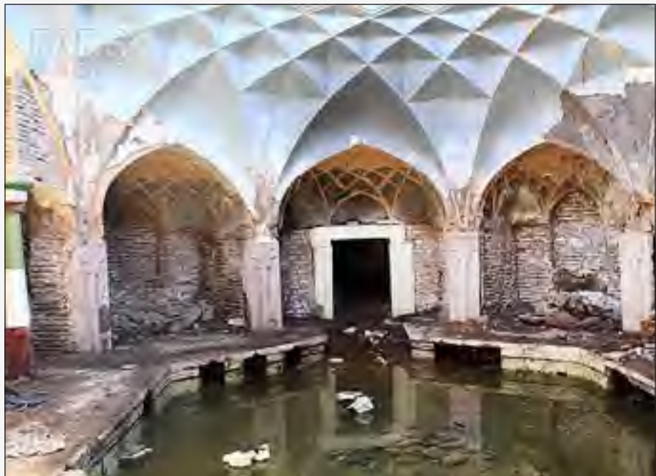
تخریب حمام تاریخی باغ لاله در سال ۱۳۸۳

مدیرعامل شرکت آب و فاضلاب استان کرمان به مهر می‌گوید: احداث شبکه فاضلاب شهر کرمان از سال ۷۶ آغاز شده است و تاکنون تقریباً معادل ۵۰۳ کیلومتر شبکه فاضلاب و آشپاها آن در استان کرمان اجرا شده است. این میزان بین ۲۷ تا ۲۸ درصد از مجموع پروژه فاضلاب