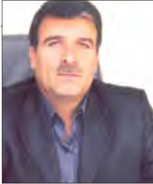
راه و شهرسازی

استاندار کرمان از انتقال حساب شرکت معدنی و صنعتی گل گهر به استان کرمان خبر داد و گفت: کلیه شرکت‌های پیمانکار طرف قرارداد و شرکت‌های وابسته باید جهت اخذ مطالبات خود از تاریخ ۱۵ مرداد ۹۴ شماره‌حساب یکی از شعب بانک‌های شهرستان سیرجان را جهت وصول مطالبات معرفی نمایند. وی گفت: کلیه خریدها که امکان تهیه آن نیز در منطقه وجود دارد باید با اولویت خرید از شهرستان سیرجان و سپس کرمان صورت پذیرد. به گزارش ایسنا، این در حالی است که استاندار کرمان در تاریخ ۲۱ خرداد ۹۴ در اولین جلسه شورای هماهنگی بانک‌های استان کرمان با تأکید بر اینکه پیمانکاران شرکت‌های مس و گل گهر حجم وسیعی گردش مالی دارند، خاطرنشان کرد: انتقال حساب‌های شرکت‌های غیردولتی به استان را تا پایان ماه رمضان تعیین تکلیف خواهیم کرد. رزم حسینی یادآور شد: به دنبال آن هستیم که بتوانیم این دو شرکت را در خصوص انتقال حساب به استان متقاعد کنیم.