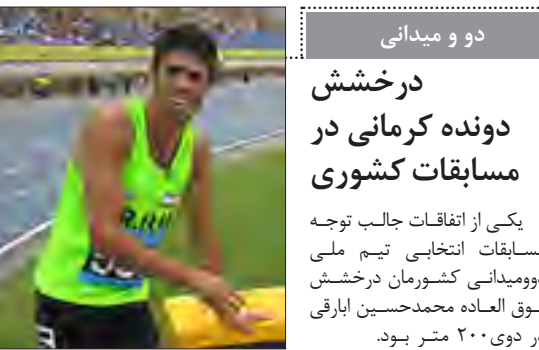
دو و میدانی