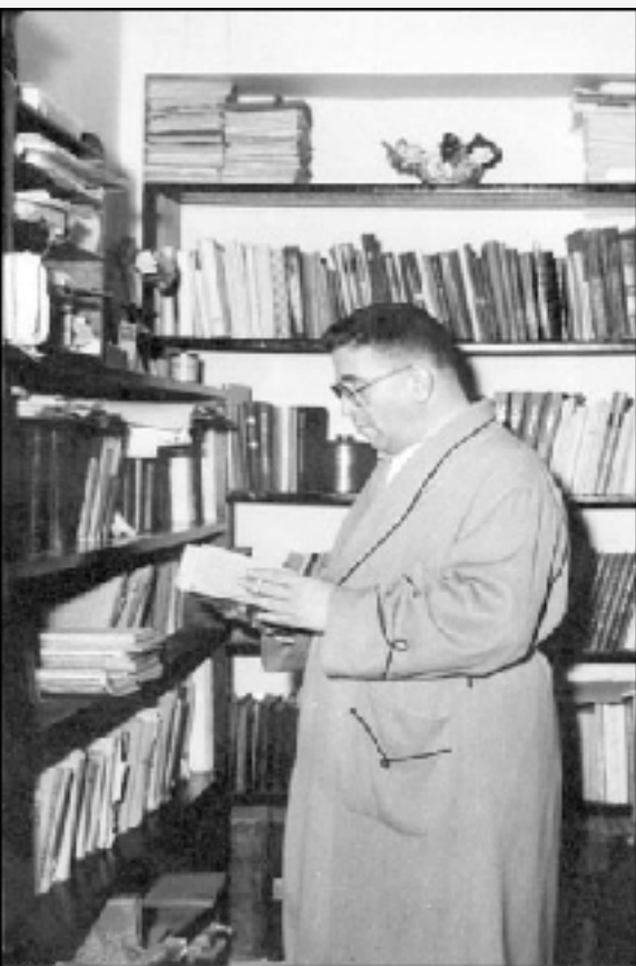
دکتر مظفر بقای کرمانی