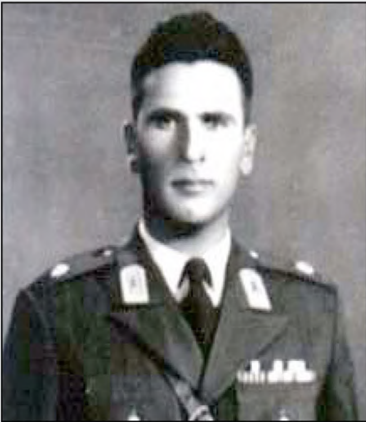
سرگرد سید محمود سخایی

در این شماره روزنامه نگاهی خواهیم داشت به خاطرات آقای صنعتی از واقعه‌ی کودتای ۲۸ مرداد سال ۱۳۳۲ در کرمان. همان گونه که خوانندگان محترم می‌دانند وقایع ۲۸ مرداد و حادثه تلخ به قتل رساندن سرگرد سید محمود سخایی، یکی از فرازهای مهم تاریخ کرمان در این دوره است.