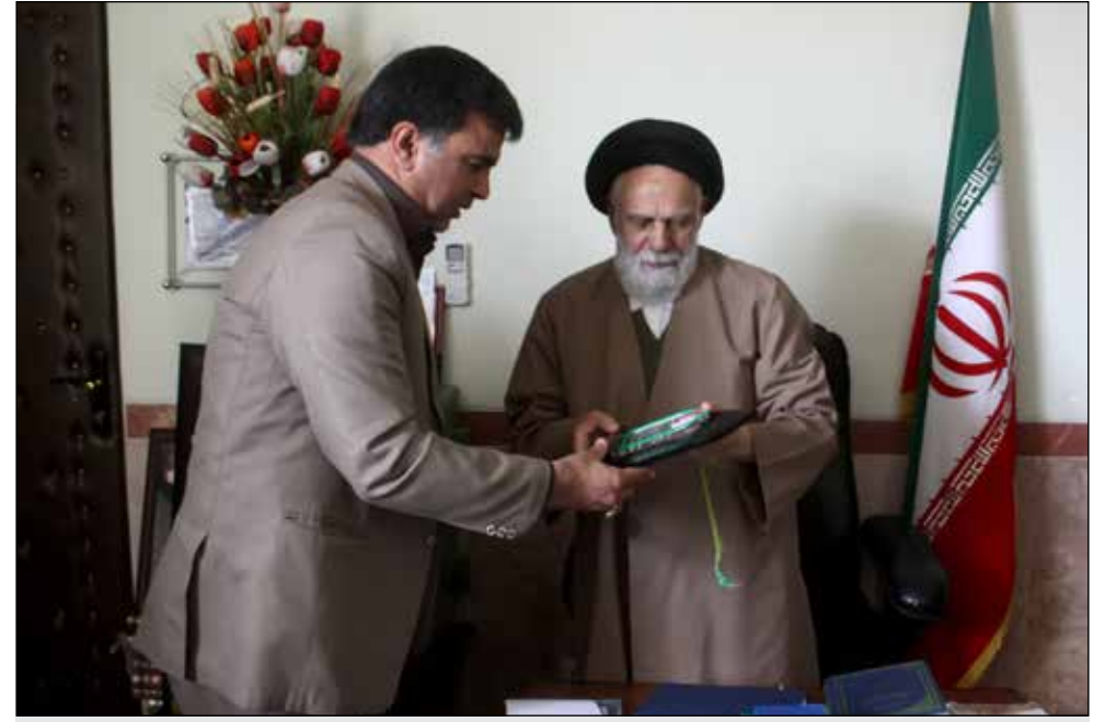
هدا تندیس یادبود شهید افضلی نیز به آیت الله جعفری

● مدیر کل اداره کار، رفاه و امور اجتماعی استان: تمام زحمات یک جامعه بر دوش کارگران است