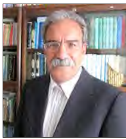
* کارشناس مسائل روسیه