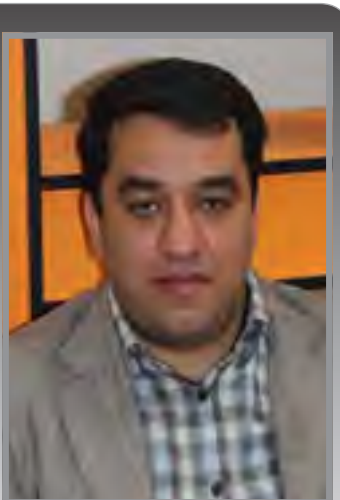
چهره برتر روابط عمومی سال: