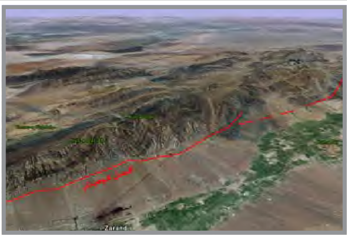
گسل کوهبنان در شمال خاوری شهرستان زرنند، فرو رفتگی زمین ساختی زرنند را از ارتفاعات و کوه های شمال خاوری زرنند جدا می سازد.

اسفند ماه سال ۸۳ زمین لرزه ای شدید با قدرت ۶.۴ ریشتر زرنند را لرزاند و بلافاصله با حدود ۳۰ پس لرزه همراه بود. این زمین لرزه زیر سایه خسارات جانی زمین لرزه بم فراموش شده است اما خسارات بسیاری بر جای گذاشت. در این حادثه دلخراش، بیش از هشت هزار ساختمان در شهر زرنند و روستاهای این شهرستان آسیب دید یا به کلی ویران شد. شمار کشته شدگان این زلزله ویرانگر، حدود ۶۱۲ نفر بود و تعداد زخمیان هزار و ۴۱۱ نفر برآورده شد. اینک دهه های اخیر شهرستان زرنند فرا رسیده است و زرنند در طی این ۱۰ سال جانی تازه گرفته است و با همه زخم ها و دردهای آن روزها، کرمان در حال حرکت است اما