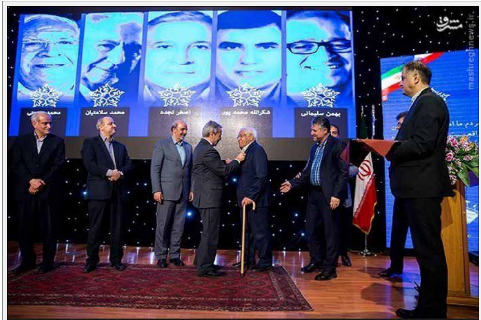
محمد باقر نوبخت رییس سازمان مدیریت و برنامه ریزی کشور در حال الصاق نشان افتخار به محمد صنعتی

خیرات در توسعه ورزش ماندگار است حجت الاسلام والمسلمین سیدحسن خیمینی هم در این همایش گفت: صدقه و خیرات در توسعه ورزش، ثوابی است که تا همیشه به یادگار می ماند. وی در نخستین همایش خیرین