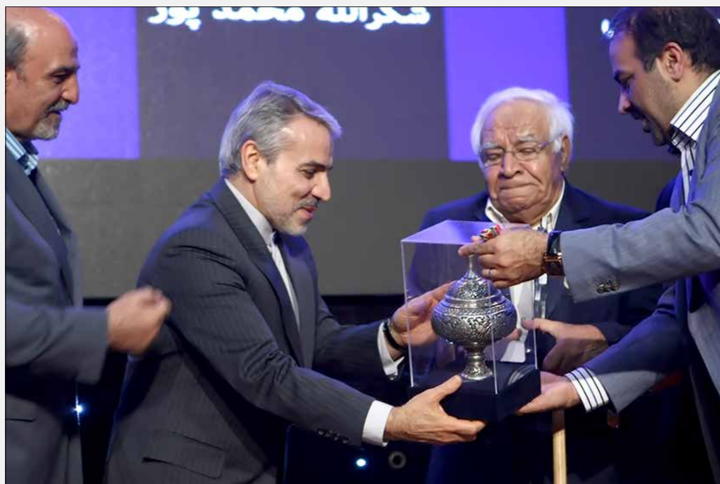
محمد باقر نوبخت رییس سازمان مدیریت و برنامه ریزی کشور در حال اعطای تندیس به محمد صنعتی

دست خیرین ورزش یار را می بوسیم معاون توسعه منابع و پشتیبانی وزارت ورزش و جوانان از شناسایی ۴۲۱ طرح نیمه تمام ورزشی برای واگذاری به خیرین ورزشیاری خبر داد و گفت: در حال حاضر ۹۲ طرح نیمه تمام به خیرین ورزشیاری ۱۶ استان واگذار شده است. سید مناف هاشمی معاون توسعه منابع و پشتیبانی وزیر ورزش و جوانان، درباره مراسم خیرین ورزشیاری اظهار داشت: تلاش ما این بود از نظر قانونی شرایطی را فراهم کنیم تا برخی پروژهها توسط خیرین تکمیل شود. ۵ هزار میلیارد تومان نیاز ما در سال ۹۵ است اما دولت مبلغی کمتر از هزار میلیارد را در سال ۹۵ در اختیار ما قرار می دهد بنابراین با چنین رقمی نمی توان پروژههای نیمه تمام را تکمیل کرد. وی افزود: ما ۲۲۲ پروژه را تعیین تکلیف کردیم که ۹۲ پروژه توسط خیرین