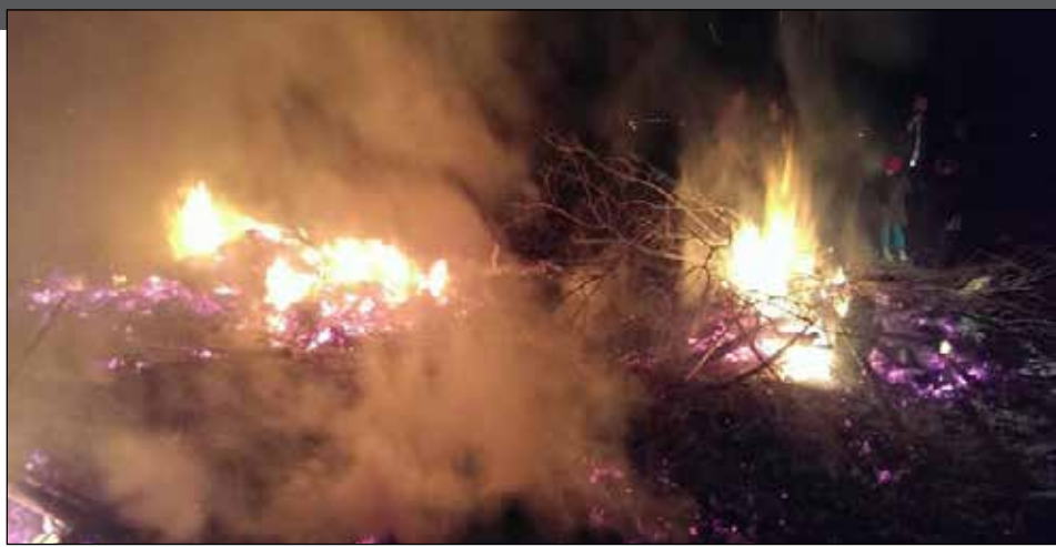
یکی از سنت های قدیمی که هنوز در میان اقوام سیرجانی به یادگار مانده جشن سده یا همان سده

کشاورزان می کوشیدند مقداری از خاکستر سده را بردارند و به نشانه پایان یافتن سرمای زمستان، گرما را به کشتزار خود ببرند. شرکت کنندگان کم کم به خانه برمی گشتند، ولی جوانانی که تا نیمه های شب پیرامون سده می ماندند، کم نبودند. «در این شب ستاره گرما به زمین می آید».