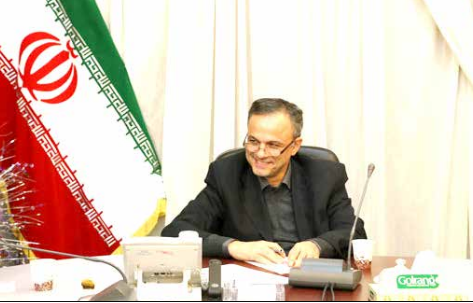
استاندار کرمان توصیه کرد: فرمانداران در مراجعات مردمی باید به حرف مردم گوش کرده و با صداقت با مردم صحبت کنند و مردم را در ادارات مختلف پاس کاری نکنند. به گزارش روابط عمومی استانداری کرمان علیرضا رزم حسینی ظهر دیروز در جمع فرمانداران استان کرمان، افزود: در حوزه مسائل فرهنگی و اجتماعی در کشور با مشکلات جدی روبرو هستیم و اقدامات انجام شده با توجه به اقدامات انجام شده، حدوداً یک به ده است. وی ادامه داد: ظرف ۱۰ روز آینده سند توسعه فرهنگی و اجتماعی استان کرمان تدوین می شود و در آن نقش تمامی نهادهای دست اندرکار امور اجتماعی و فرهنگی به خوبی دیده شده است. عالی ترین مقام اجرایی دولت

شهردار کرمان از پررنگ تر شدن نقش فرهنگ و فعالیت های اجتماعی در پروژه های عمرانی خبر داد. به گزارش مهر، علی بابایی دیروز در جمع خبرنگاران با بیان این که شهرداری خواهان مشارکت شهروندان در امور شهر است، اظهار کرد: مسائل شهر و شهرداری باید برای مردم ملموس شده و خود را در زندگی مردم نشان دهند تا مشارکت و همراهی شهروندان جذب شود. بابایی با اشاره به نامه ۱۳۰ نفر از فعالان اجتماعی و فرهنگی علاقه مند به مشارکت در مدیریت شهری تصریح کرد: اگر شهر نیاز به کار عمرانی دارد، به اقدامات فرهنگی و اجتماعی نیز نیازمند است. وی تصریح کرد: به همین دلیل است که به دنبال پررنگ کردن نقش فرهنگ و فعالیت اجتماعی در شهرداری هستیم.