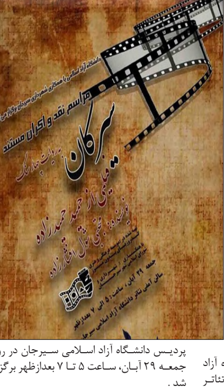
پردیس دانشگاه آزاد اسلامی سیرجان در روز جمعه ۲۹ آبان، ساعت ۵ تا ۷ بعدازظهر برگزار شد.

حضور بردیا کیارس در کرمان آموزشگاه «همساز کرمان» با دعوت از «بردیا کیارس» دستیار ارکسترسمفونی ایران برای اولین بار در کرمان کارگاه آموزشی برای گروه «انسامبل زهی کرمان» برگزار کردند. این گروه متشکل از ۲ نفر خانم و ۹ نفر آقای نوازنده است. بردیا کیارس از سن ۴ سالگی نوازندگی سنتور را نزد پدر خود آغاز نمود و تئوری موسیقی را زیر نظر مهران روحانی و آهنگسازی را نزد سعید شریفیان فراگرفت و از سال ۷۴ نزد استادانی همچون سبیل ده‌بستی و ابراهیم لطفی نواختن ویولن را آموخت. کیارس طی سال‌های گذشته جزو نوازندگان پرکار به‌شمار می‌آید و به عنوان رهبر کنسرت در ارکسترهای تهران فعالیت کرده و با هنرمندان برجسته‌ای همکاری داشته است. او از سال ۷۷ آهنگسازی فیلم را آغاز کرده و تا امروز موسیقی ۲۰ فیلم سینمایی و چندین مجموعه تلویزیونی و فیلم کوتاه را ساخته است. جمعه ۲۹ آبان‌ماه اولین جلسه این کارگاه آموزشی مبنی بر آموزش گروه نوازی کلاسیک برگزار شد که قرار است در ماه های آینده در چند جلسه تکرار گردد.