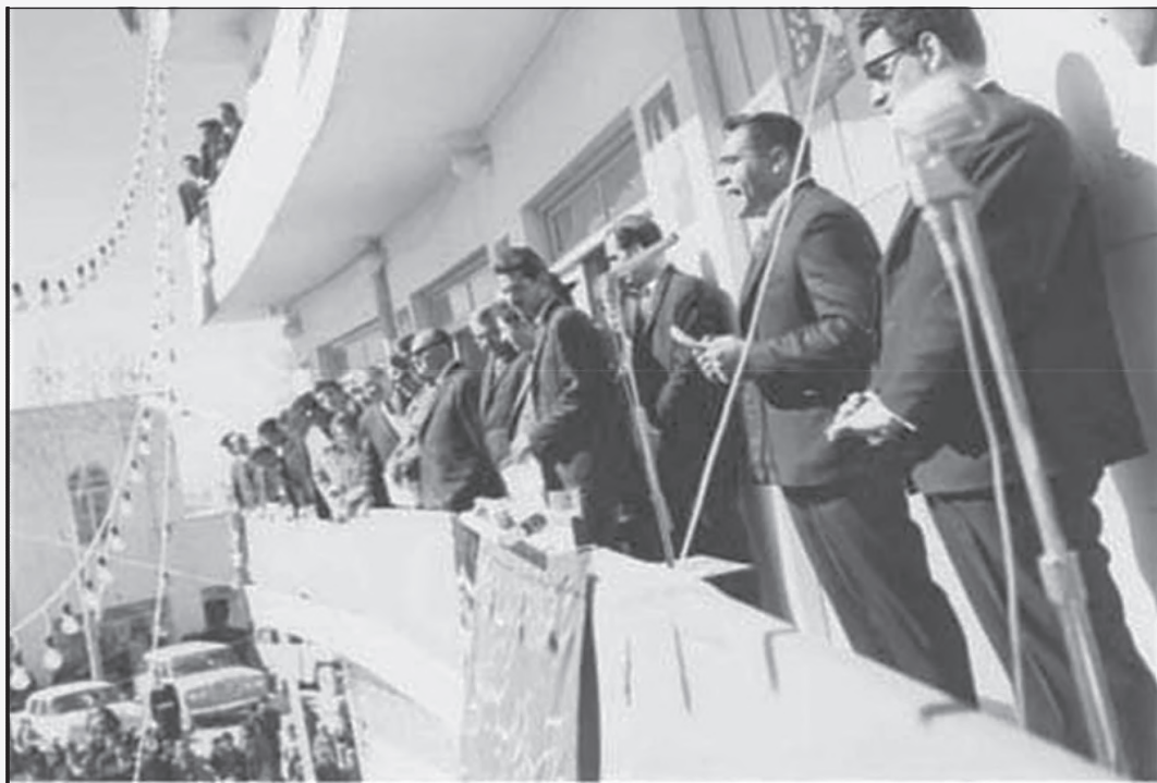
سخنرانی محمد صنعتی در گردهمایی تعدادی از مردم و اصناف کرمان - ۱۳۴۲ ش. مکان: میدان مشتاقیه (ساختمان دینیار)

توضیح عکس: در گذشته نظر به شرایط خاص کرمان و وجود افرادی چون دکتر مظفر بقایی، سید احمد رضوی و ... بعضاً برخی از رجال سیاسی ایران به دعوت آنان و احزاب به کرمان می‌آمدند و جلسات سخنرانی و نقد سیاسی برپا می‌شد که البته بیشتر در جهت تبلیغات رژیم منحوس پهلوی ارزیابی می‌گردد.