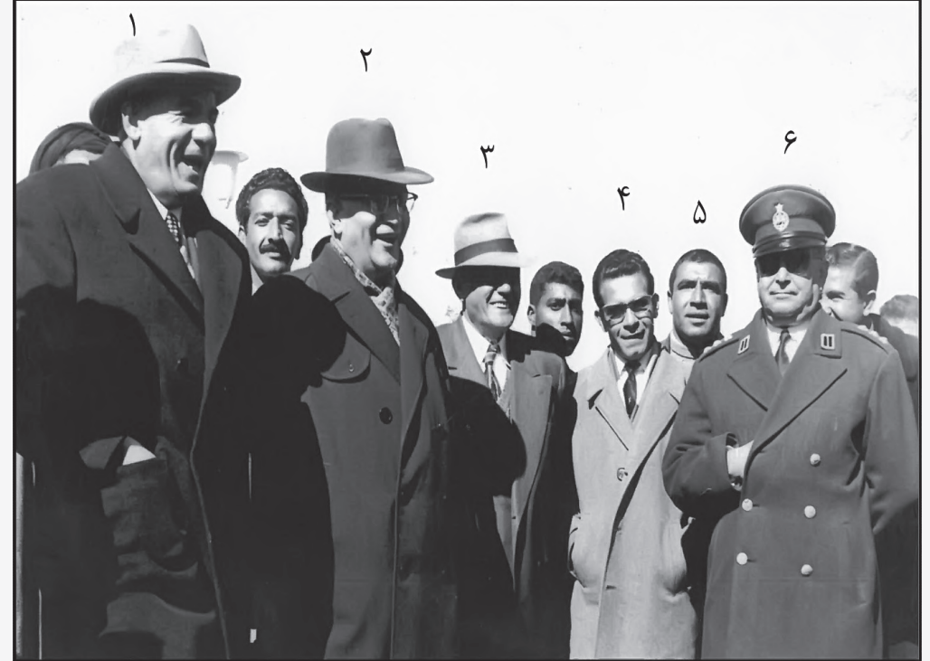
حضور چند نفر از رجال سیاسی ایران در کرمان - ۱۳۴۱ ش.

توضیح عکس: پس از تشکیل حزب ایران نوین، حسن علی منصور معدوم شده توسط فدائیان اسلام در آذر سال ۱۳۴۲ سفری به کرمان داشت و از روند تشکیل و روند این حزب در کرمان بازدید نمود.