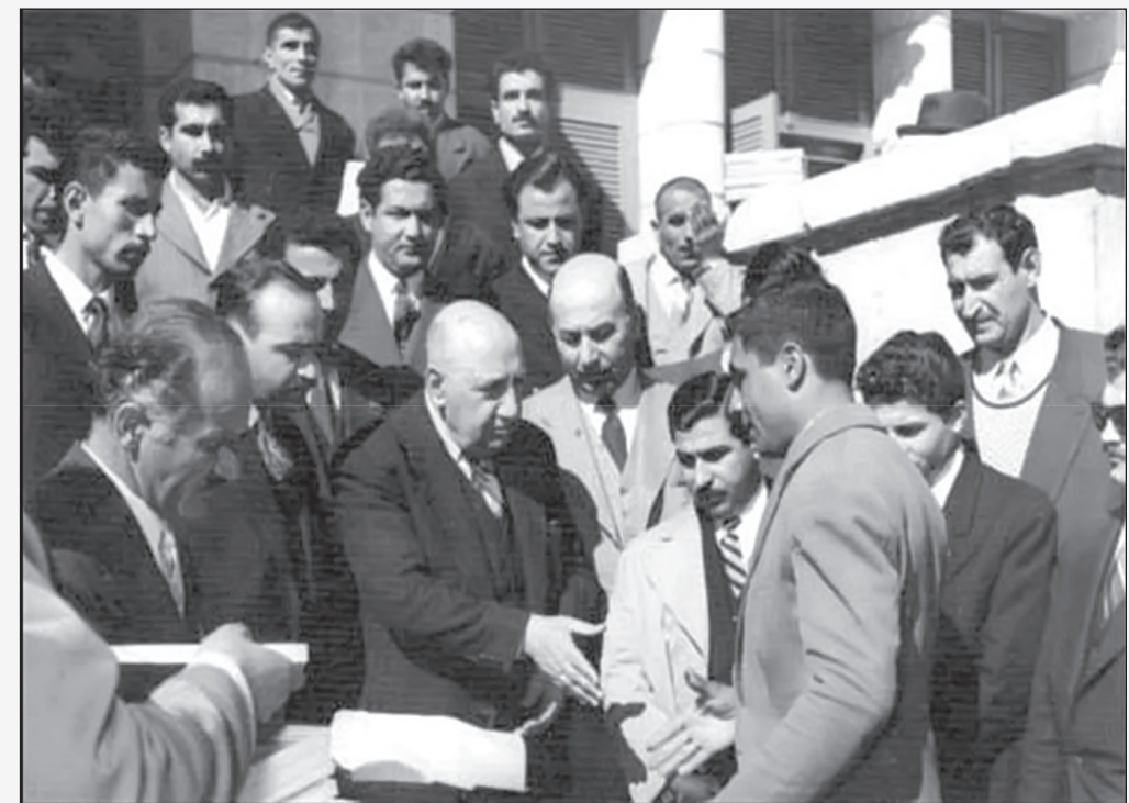
دریافت مدرک پایان دوره فنی و حرفه‌ای از دکتر نصر (وزیر کار) - ۱۳۳۴ ش.

توضیح عکس: همان گونه که قبلاً هم متذکر شدم، در این مقطع زمانی، اکثر سخنرانی‌ها و تجمع‌های مردمی در میدان مشتاقیه برگزار می‌شد. البته در سال‌های ۱۳۲۰ تا ۱۳۳۲ در ضلع شمالی میدان مشتاقیه (مابین خیابان زریسف و ناصریه، بالای ساختمان گاراژ مسافربری ایران پیم) دفتر شرکت نفت قرار داشت و سخنرانی‌ها و اجتماعات که اکثراً وابسته به حزب توده بود، در این ضلع میدان صورت می‌گرفت. از حدود سال ۱۳۴۰ ش. به بعد، سخنرانی‌ها و اجتماعات مردمی به ضلع غربی میدان مشتاقیه (ابتدای خیابان ناصریه) انتقال یافت و سخنرانان از بالکن ساختمان سه طبقه دینیار سخنرانی می‌نمودند و مردم هم در پایین ساختمان اجتماع می‌نمودند. در ضلع دیگر میدان (حدود درب مسجد جامع) دفتر حزب زحمتکشان قرار داشت و معمولاً دکتر مظفر بقایی کرمانی از بالکن همین ساختمان سخنرانی می‌کرد و طرفدارانش نیز در پایین ساختمان اجتماع می‌نمودند. از دیگر وقایع تاریخی حادث شده این دوران در میدان مشتاقیه، بایستی به اجتماع طرفداران جمعیت هواداران صلح در سال ۱۳۳۰ ش. (مابین خیابان شریعتی و میرزا رضا کرمانی، حدود دفتر حزب زحمتکشان) اشاره نمود، که به دلیل نداشتن مجوز قانونی، این اجتماع منتهی به درگیری آنان با نیروهای انتظامی و کشته شدن یک نفر گردید. در روز ۲۸ مرداد سال ۱۳۳۲ ش. نیز بایستی از به دار آویختن جنازه متلاشی شده سرگرد سید محمود سخایی و عمل ناجوانمردانه و شنیع افرادی به جنازه وی (مابین خیابان‌های ناصریه و شریعتی) یاد کنم (محمد صنعتی).