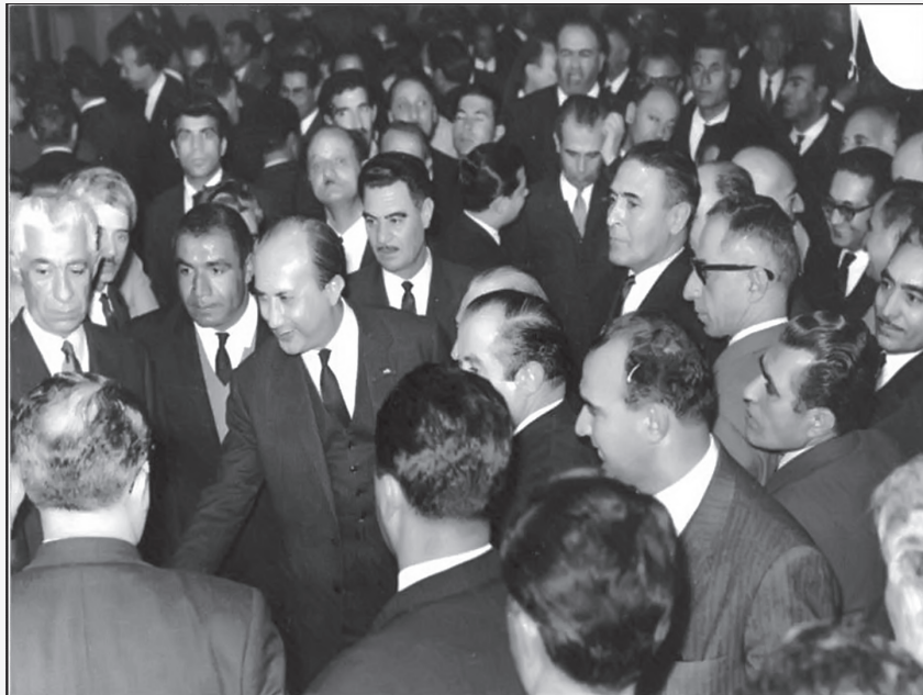
بازدید حسن علی منصور معدوم (نخست‌وزیر و دبیرکل حزب ایران نوین) - آذر ۱۳۴۲

توضیح عکس: پس از تشکیل حزب ایران نوین، حسن علی منصور معدوم شده توسط فدائیان اسلام در آذر سال ۱۳۴۲ سفری به کرمان داشت و از روند تشکیل و روند این حزب در کرمان بازدید نمود.