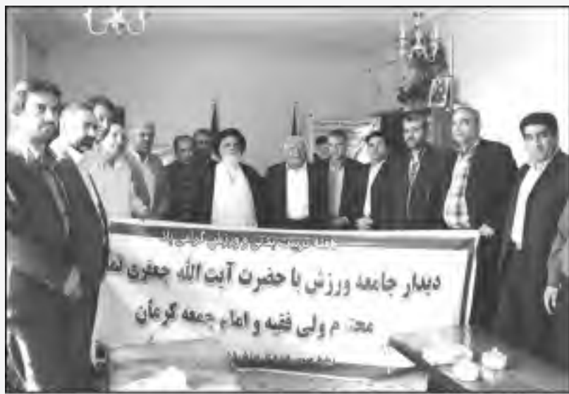
دیدار جامعه ورزش با آیت الله جعفری (نماینده ولی فقیه و امام جمعه کرمان) در هفته تربیت بدنی و ورزش - ۱۳۹۳ ش.

حکم انتصاب محمد صنعتی به مشاور در امور پیشکسوتان ورزش استان کرمان - ۱۳۹۳ ش.