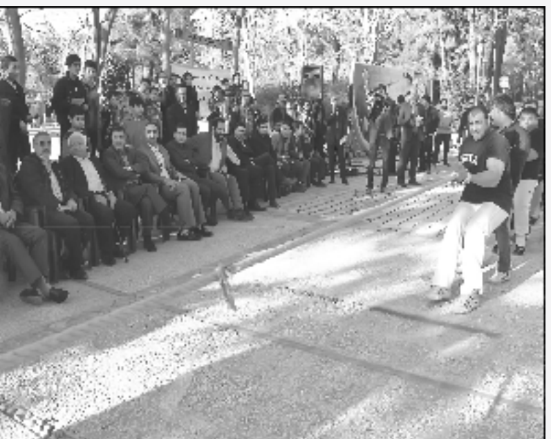
گوشه ای از مسابقه طناب کشی جام حاج محمد صنعتی - بهمن ۱۳۹۲ ش

مسابقه طناب کشی جام حاج محمد صنعتی در راستای بزرگداشت و تکریم از تلاش و خدمات پیشکسوتان ورزش استان کرمان، به همت هیئت انجمن های ورزشی شهرستان کرمان و با همکاری هیئت