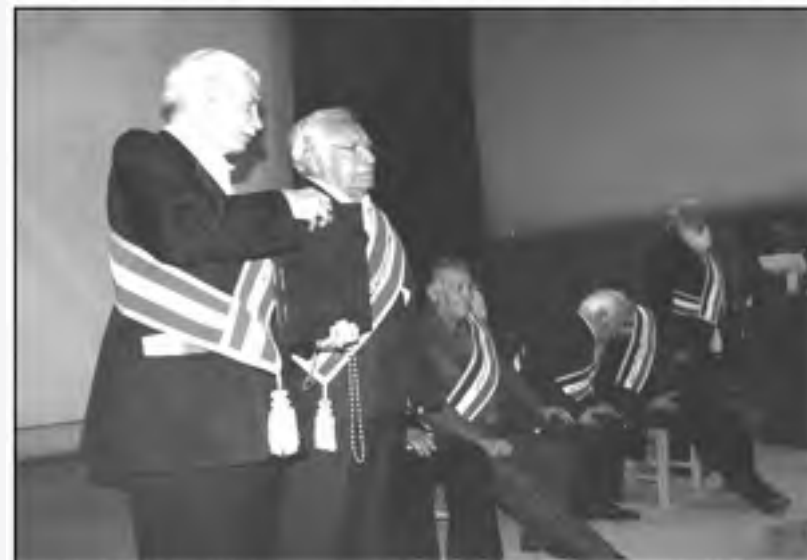
دیدار جامعه ورزش با آیت الله جعفری (نماینده ولی فقیه و امام جمعه کرمان) در هفته تربیت بدنی و ورزش - ۱۳۹۳

حکم انتخاب محمد صنعتی به عنوان مشاور مدیر عامل در امور پیشکسوتان و عضو شورای سیاست گذاری امور فرهنگی باشگاه عس - ۱۳۹۱