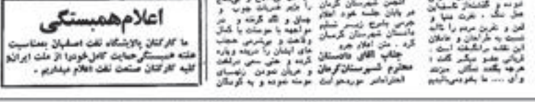
گزارش روزنامه کیهان از جلسه انجمن شهرستان و متن اعلام جرم