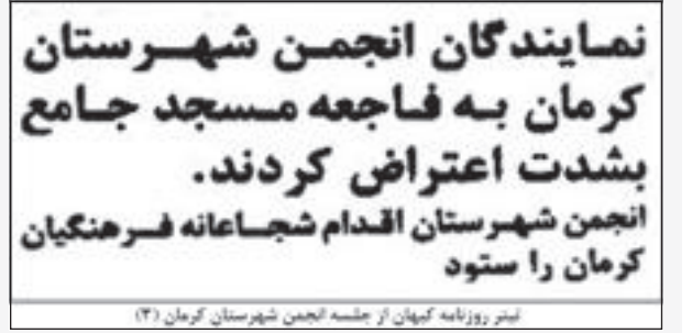
نمایندگان انجمن شهرستان کرمان به فاجعه مسجد جامع بشدت اعتراض کردند. (بهر روزنامه کیهان از جلسه انجمن شهرستان کرمان ۲۴)