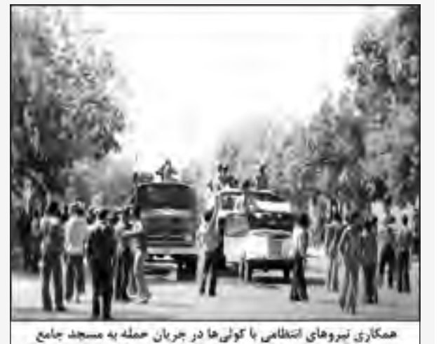
همکاری نیروهای انتظامی با کولی‌ها در جریان حمله به مسجد جامع

پس از تحقیق دقیق از این واقعه و اشراف به جریان رخ داده، به رغم آن که بسیاری از دوستان و مسئولین دستگاه‌های دولتی بنده را توصیه به سکوت می‌نمودند، در یکی از جلسات انجمن، با محکوم نمودن این فاجعه، متن اعلام جرمی را صادر و برای تمامی مسئولین فرستادم. این متن که در روزنامه‌های سراسری