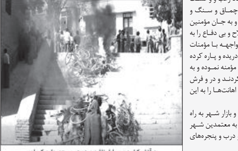
به آتش کشیدن وسایل نقلیه مردم در مسجد جامع کرمان

از مقام معظم دادستانی تقاضای رسیدگی فوری و سریع به این موضوع و شناسایی و صدور دستور تعقیب و پیگرد عاملان و طراحان این حادثه غم‌انگیز را در هر گروه و مقامی دارد و با توجه به وظیفه سنگین و بااهمیتی که آن جناب بر عهده دارند و با توجه به وضعیت خطیر و حساسی که پیش آمده است اینک همه مردم تمامی امیدشان به اقدامات دقیق و فوری و بدون اغماض آن جناب است تا همان‌گونه که به عرض رسید عاملان و طراحان این واقعه غم‌انگیز و ننگین در هر گروه و مقامی شناسایی و تعقیب و به عدالت سپرده شوند و به شدیدترین وجهی به کیفر اعمال ننگین خود برسند.