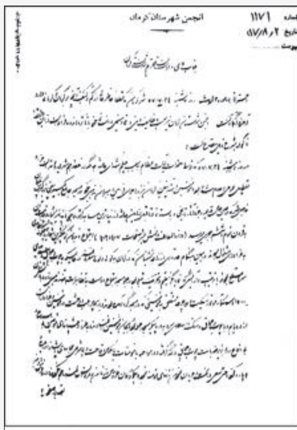
صفحه اول اعلام جرم به فاجعه مسجد جامع کرمان

ما زنده به آنیم که آرام نگیرم موجیم که آسودگی ما عدم ماست