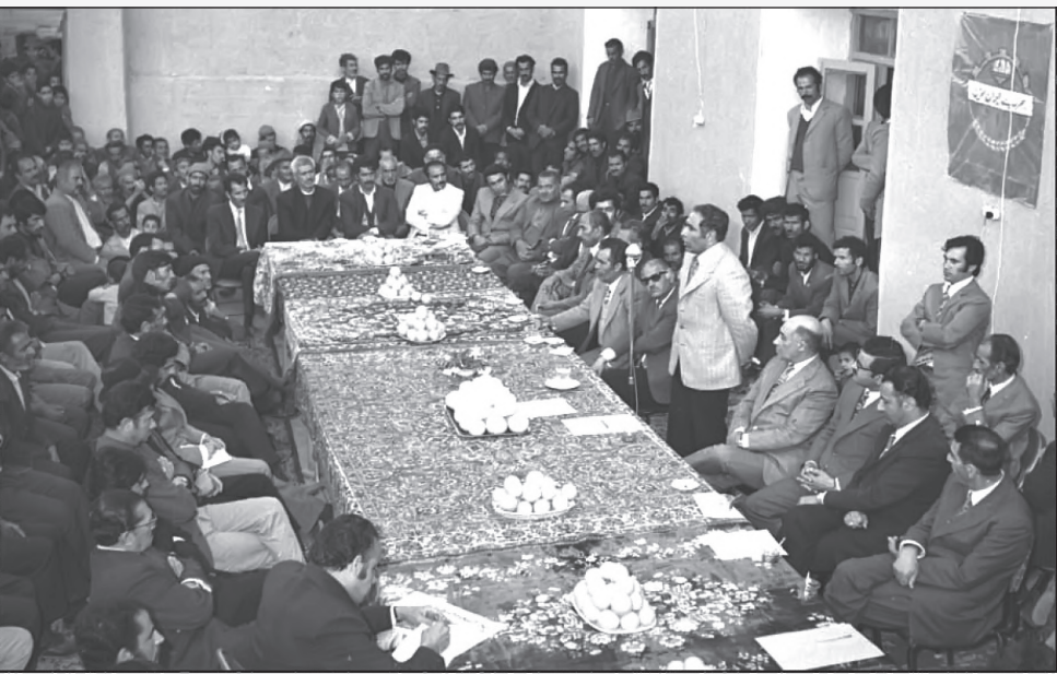
بازدید انجمن شهرستان از شهادت (جلسات سیار) - ۱۳۵۱ ش.

تومان کمک کرد و خواستار تأمین برق هنرستان این منطقه نیز شد. وی افزود: برای تأمین آب لوله‌کشی جوشان، هشتادان و سعدآباد نیز باید هر چه زودتر اقدام شود. رییس انجمن شهرستان در انتقاد از انجمن ده رشیدیه گفت: اعتباری برای ساختن یک باب مدرسه در اختیار انجمن ده این