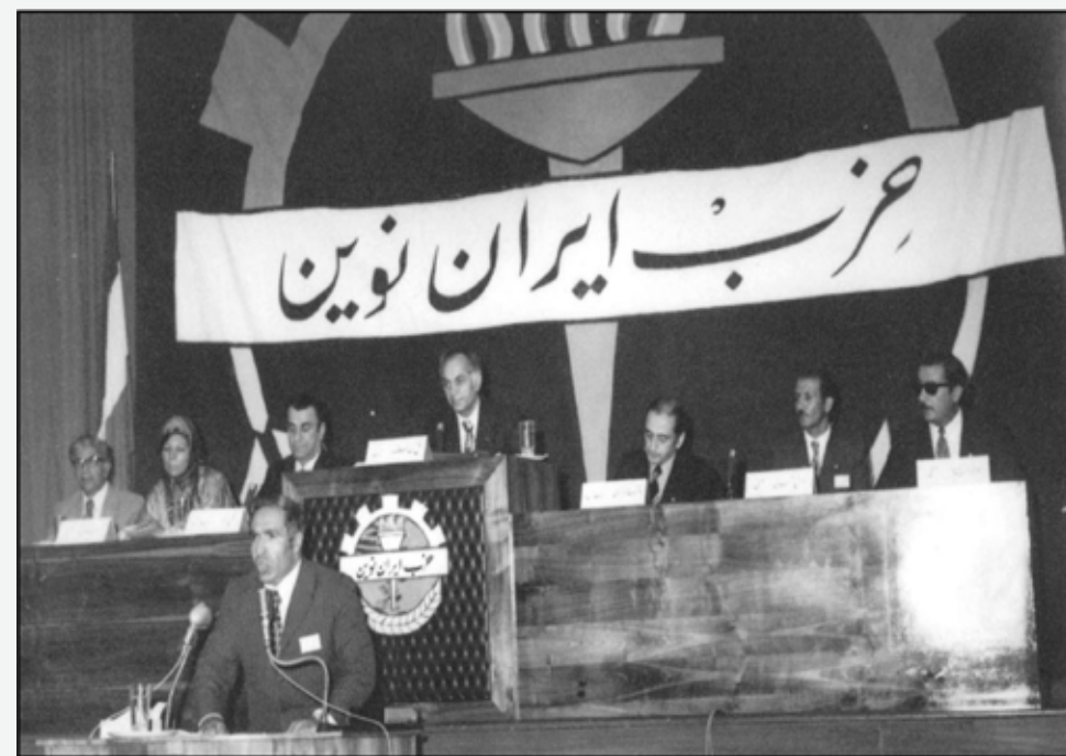
سخنرانی محمد صنعتی در شورای مرکزی حزب ایران نوین تهران ۱۳۵۲ ش.

رسیدگی به مشکل کسری انبار قند و شکر کرمان، یکی از مباحثی بود که در سال ۱۳۵۲ ش. در انجمن شهرستان کرمان مطرح گردید و به طور مفصل به آن پرداخته شد. در گزارش